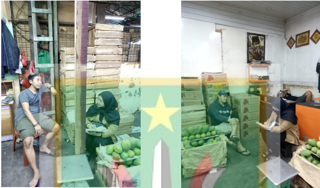
Gambar 4. Wawancara dengan Pedagang Besar Mangga di Pasar Induk Kramat Jati