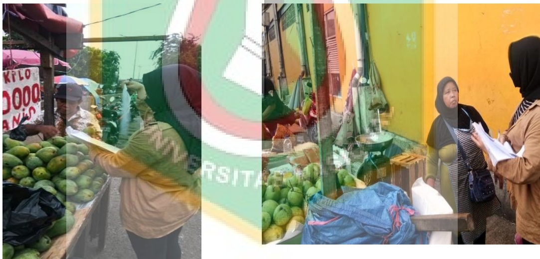
Gambar 5. Wawancara dengan Pedagang Pengecer di Pasar Minggu