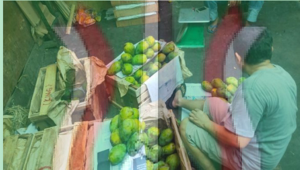
Gambar 9. Kegiatan Menata Mangga dan Menyortir Mangga yang Busuk