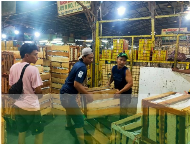
Gambar 11. Kegiatan Muat Mangga yang dibeli Pedagang Pengecer untuk Diangkut menuju Tempat Mereka Berjualan