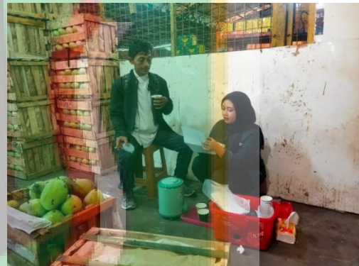
Gambar 7. Wawancara dengan Pedagang Pengecer yang Sedang Berbelanja Mangga di Pasar Induk Kramat Jati