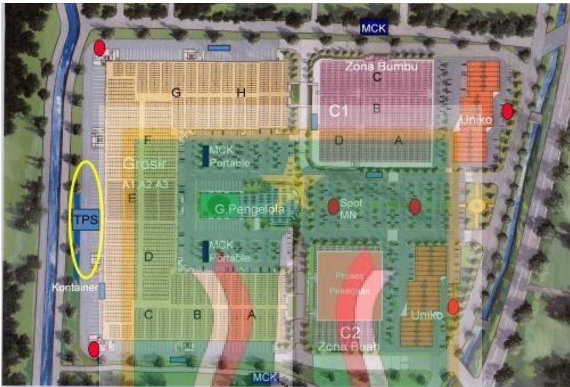
Lampiran 6. Denah Pasar Induk Kramat Jati