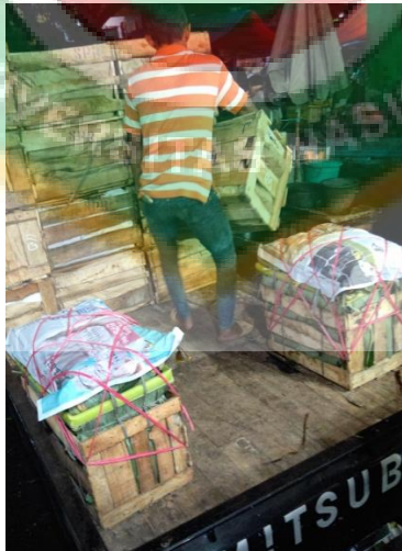
Gambar 10. Proses Bongkar Mangga dari Truk untuk Dipindahkan ke Lapak Pedagang di Pasar Induk Kramat Jati