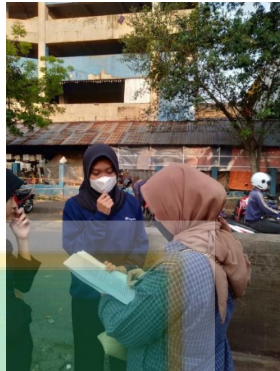
Gambar 6. Wawancara dengan Konsumen Mangga di Pasar Minggu