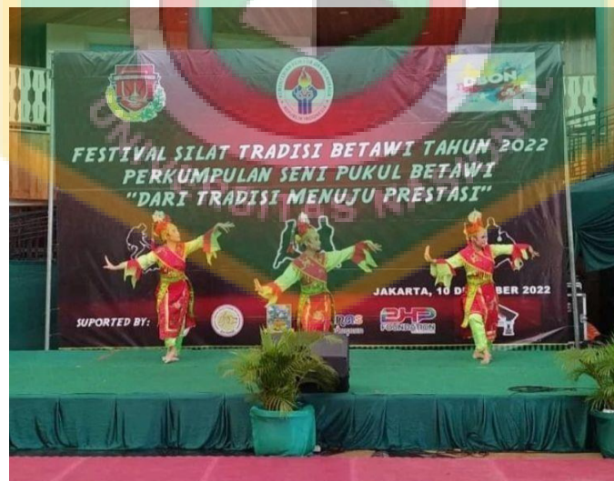
Event festival silat tradisi yang diadakan di desa wisata Set Babakan

Infografis mengenai promosi publikasi program kegiatan puncak tahun baru yang di adakan Humas Unit Pengelola Kawasan Perkampungan Budaya Betawi melalui media sosial