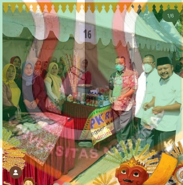
Bazar bertemakan Kuliner Khas Tradisional Betawi yang dijalankan pihak pengelola yang bekerja sama dengan Umkm setempat guna membina relationship