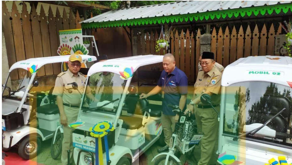
Fasilitas akomodasi wara wiri yang disediakan Unit Pengelola yang bekerjasama dengan PLN untuk pengunjung