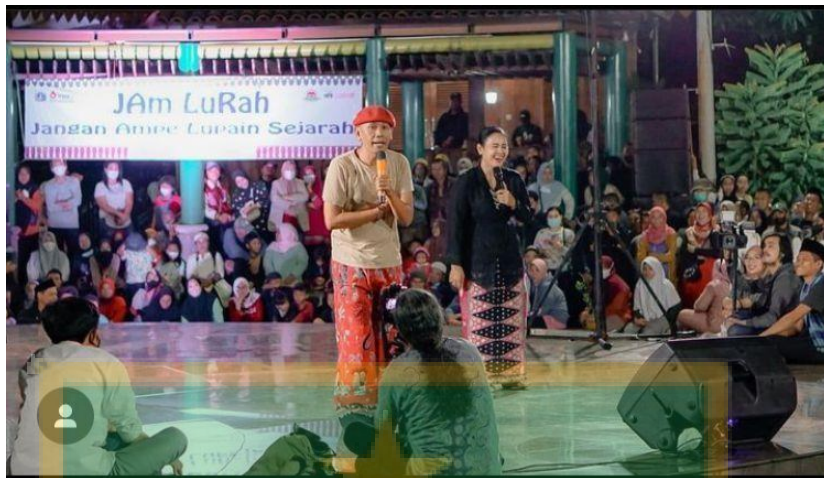
Lenong Betawi yang di selenggarakan Unit Pengelola Kawasan Perkampungan Budaya Betawi di Amphitheater guna meningkatkan daya tarik pengunjung