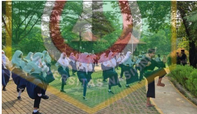
Salah satu kegiatan wisata edukasi kunjungan sekolah dan memperkenalkan workshop kuliner dan workshop silat Betawi kepada siswa-siswa