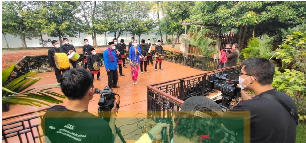
Event khusus kesenian alat music tanjidor yang diselenggarakan di rumah makan Betawi dari Dinas Kebudayaan DKI Jakarta