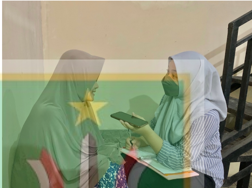
Lampiran 10 : Dokumentasi dengan Informan Kunci Kedua ( Kepala Keamanan Mall ITC BSD Informan “T”)