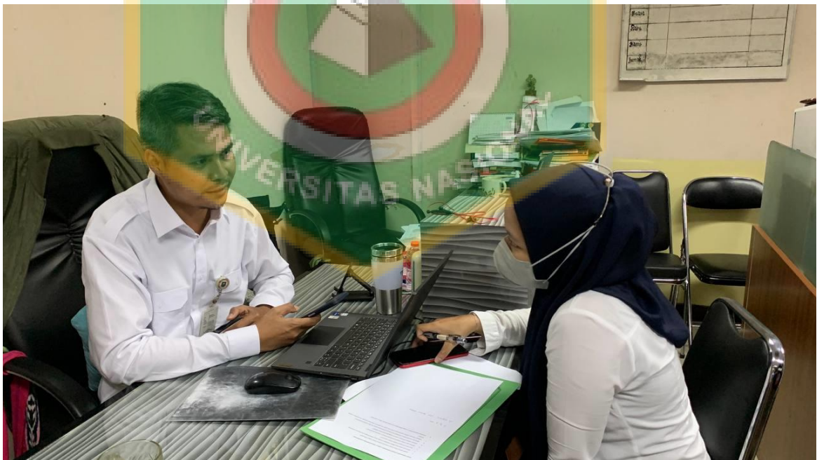
Informan saat melakukan wawancara dengan penulis