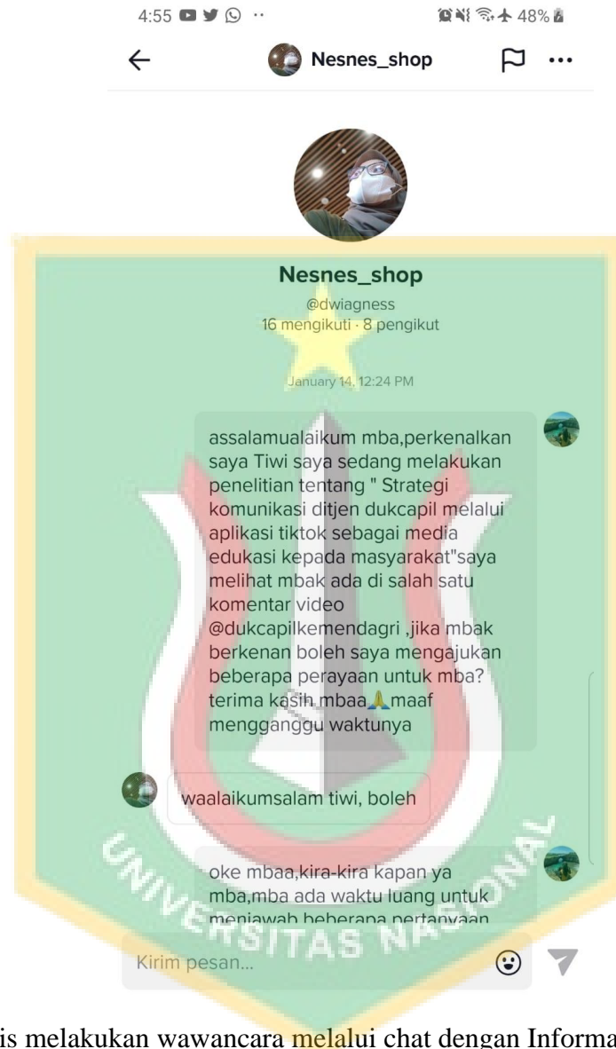
Penulis melakukan wawancara melalui chat dengan Informan Pendukung