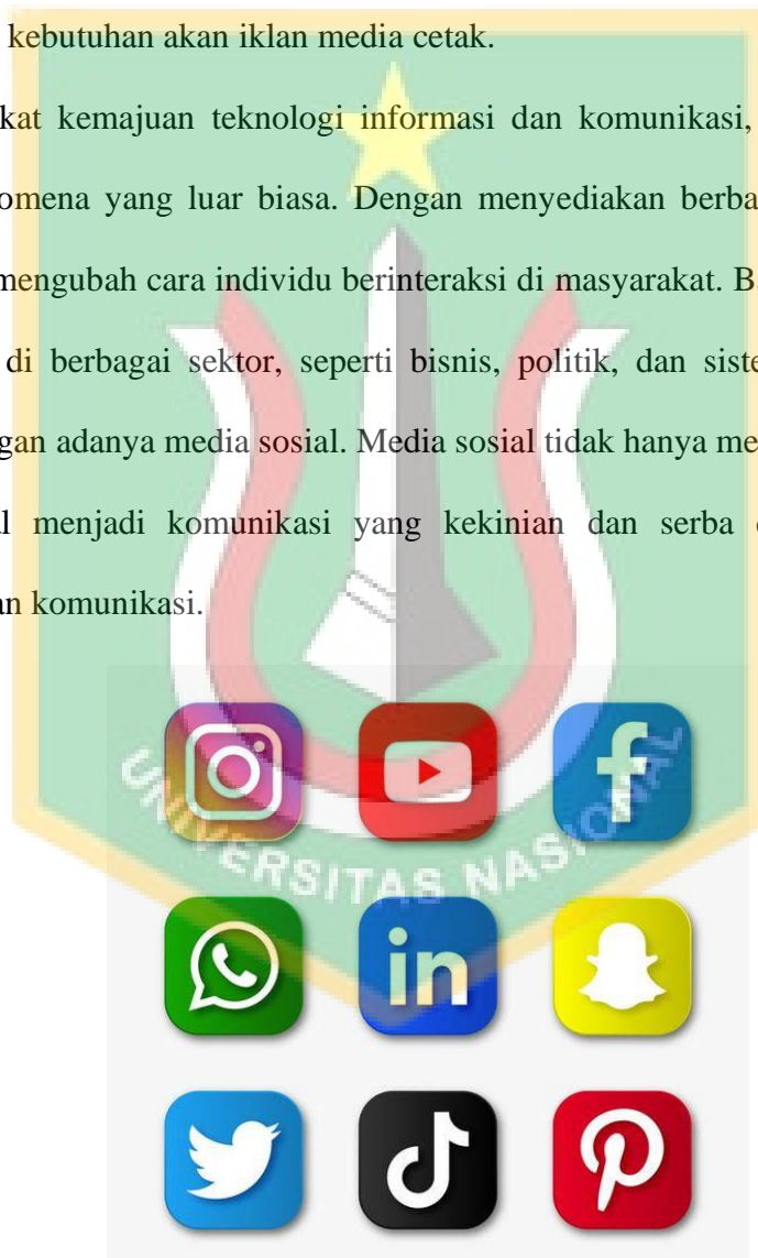
Gambar 1.1 Media Online

Berkat kemajuan teknologi informasi dan komunikasi, media sosial telah menjadi fenomena yang luar biasa. Dengan menyediakan berbagai layanan, media sosial telah mengubah cara individu berinteraksi di masyarakat. Bahkan cara individu berinteraksi di berbagai sektor, seperti bisnis, politik, dan sistem pendidikan pun berubah dengan adanya media sosial. Media sosial tidak hanya mengubah komunikasi konvensional menjadi komunikasi yang kekinian dan serba digital, tetapi juga meningkatkan komunikasi.