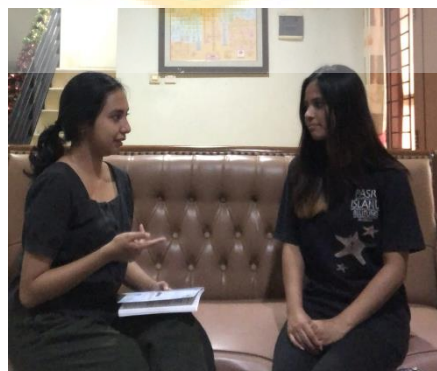
Gambar 3 wawancara dengan AD selaku alumni program pelatihan kerja Kota Depok