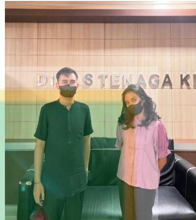
Gambar 1 wawancara dengan D selaku pegawai bidang pelatihan Dinasker Kota Depok