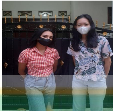
Gambar 4 wawancara dengan KU selaku alumni program pelatihan kerja Kota Depok