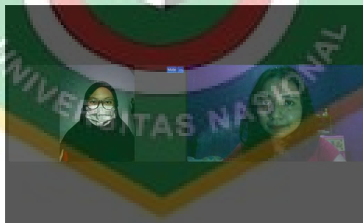
Gambar 6 wawancara dengan MNA selaku alumni program pelatihan kerja Kota Depok