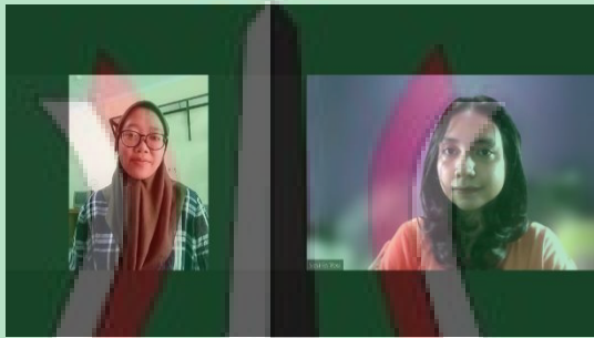
Gambar 5 wawancara dengan H selaku alumni program pelatihan kerja Kota Depok