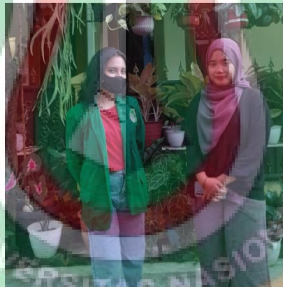
Gambar 2 wawancara dengan KN selaku alumni program pelatihan kerja Kota Depok