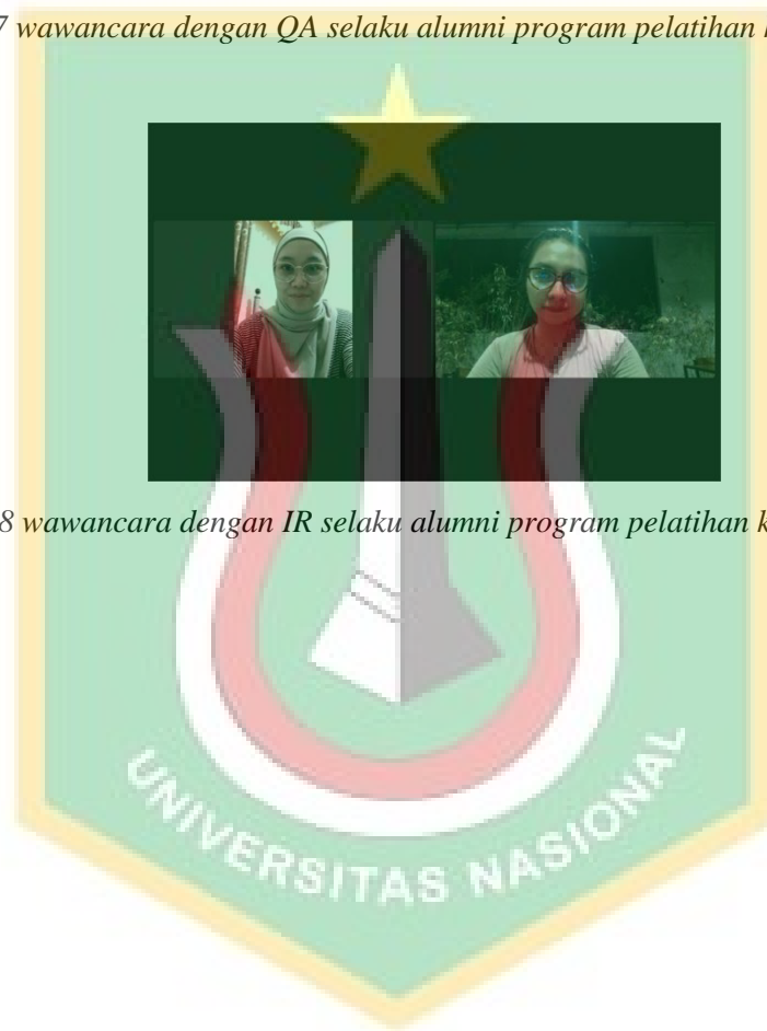
Gambar 8 wawancara dengan IR selaku alumni program pelatihan kerja Kota Depok