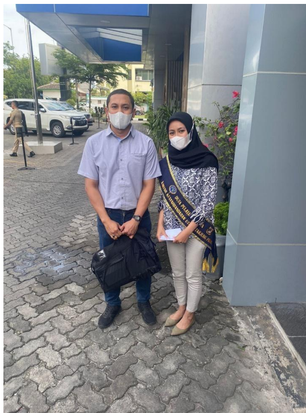
Wawancara dengan Pengguna Jasa Di Kantor Kesyabandaran Utama Tanjung Priok