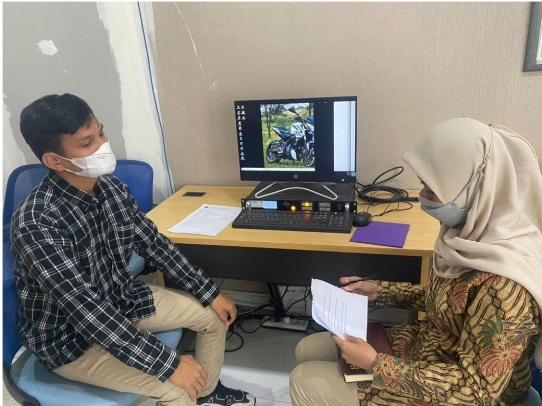
Wawancara dengan Pengguna Jasa Di Kantor Kesyabandaran Utama Tanjung Priok