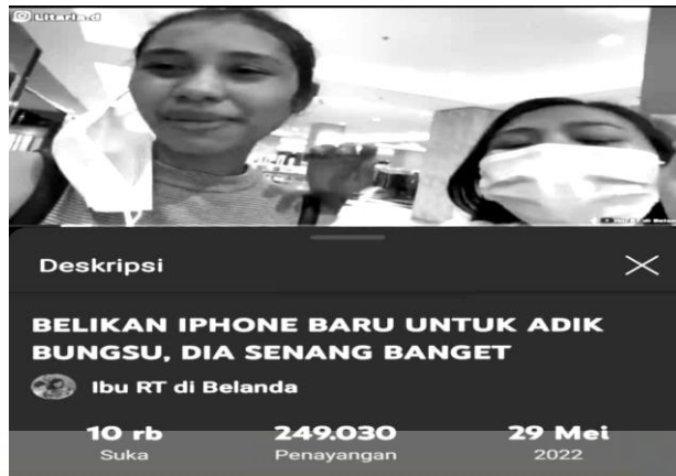
Gambar 3: Video berjudul “Belikan Iphone Baru untuk Adik Bungsu, Dia Senang Sekali”