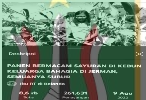
Gambar 4: Video berjudul; “Panen Berbagai Sayuran di Kebun Keluarga Bahagia di Jerman”