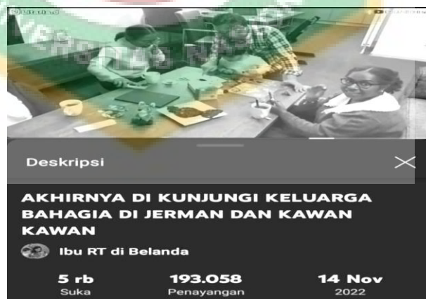
Gambar 6: Video berjudul “Akhirnya di Kunjungi Keluarga Bahagia di Jerman dan Kawan-Kawan”