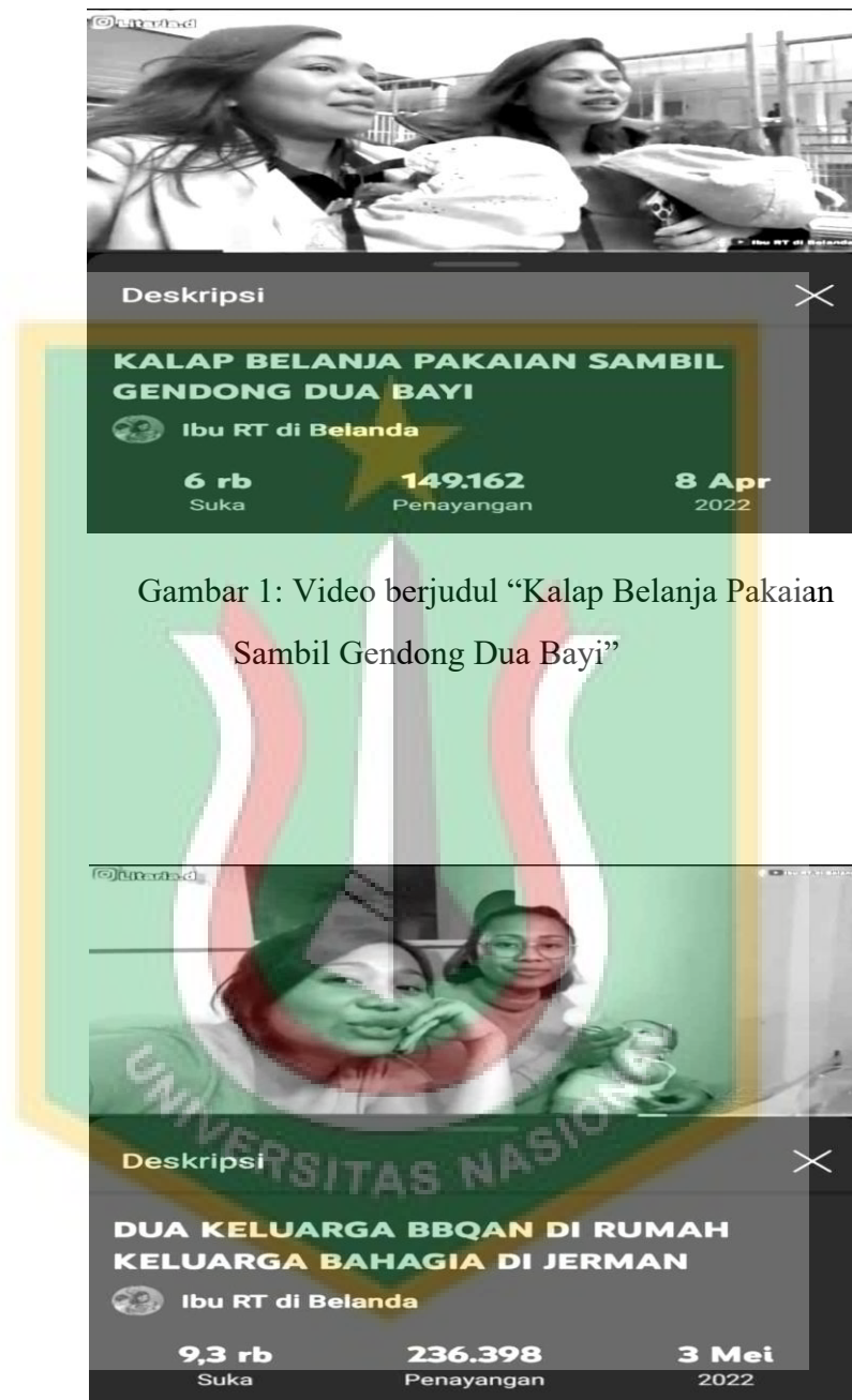
Gambar 1: Video berjudul “Kalap Belanja Pakaian Sambil Gendong Dua Bayi”