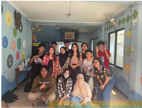
Gambar 10. Kegiatan Powertea