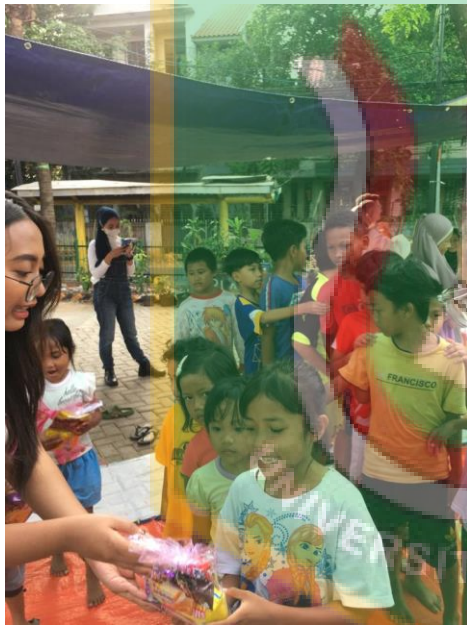
Gambar 12. Kegiatan Powertea