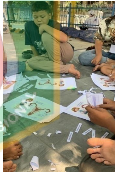
Gambar 9. Kegiatan Powertea