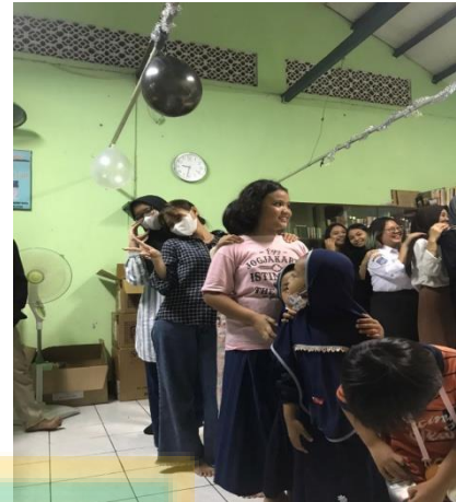
Gambar 11. Kegiatan Powertea