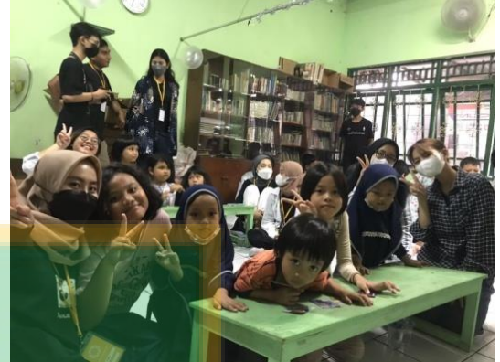
Gambar 7. Kegiatan Powertea