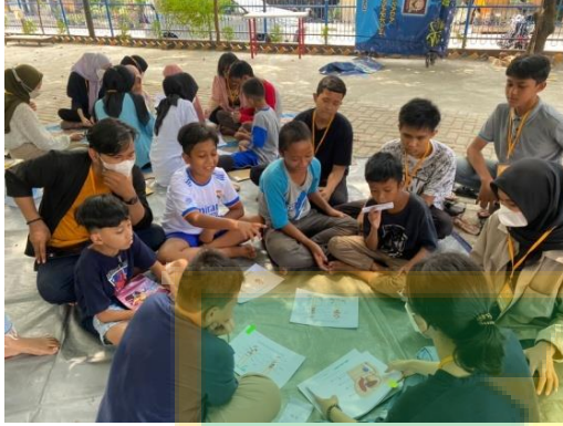
Gambar 6. Kegiatan Powertea