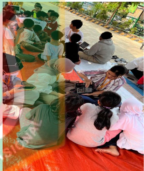
Gambar 13. Kegiatan Powertea