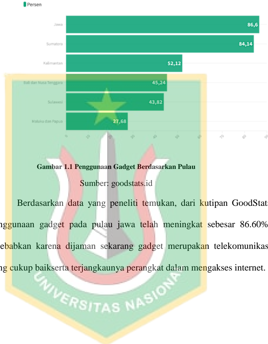
Gambar 1.1 Penggunaan Gadget Berdasarkan Pulau