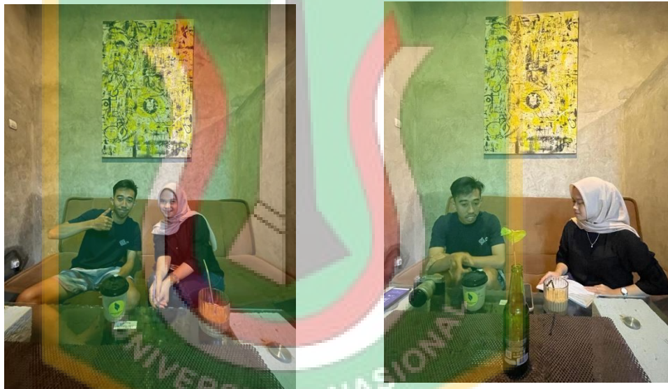
Foto pada saat wawancara dengan informan

Foto pada saat wawancara dengan key informan, yaitu owner Kafe Kopitography.