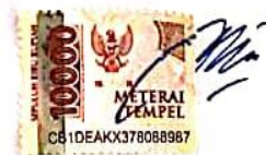
Amino Galih Prasetyo