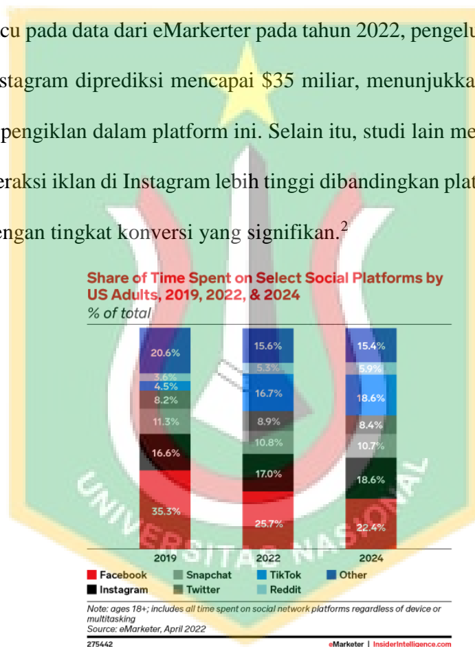
Gambar 1.2 Data Pengeluaran Iklan Media Sosial

Mengacu pada data dari eMarketer pada tahun 2022, pengeluaran global untuk iklan di Instagram diprediksi mencapai $35 miliar, menunjukkan tingginya minat bisnis dan pengiklan dalam platform ini. Selain itu, studi lain menunjukkan bahwa tingkat interaksi iklan di Instagram lebih tinggi dibandingkan platform sosial media lainnya, dengan tingkat konversi yang signifikan. 2