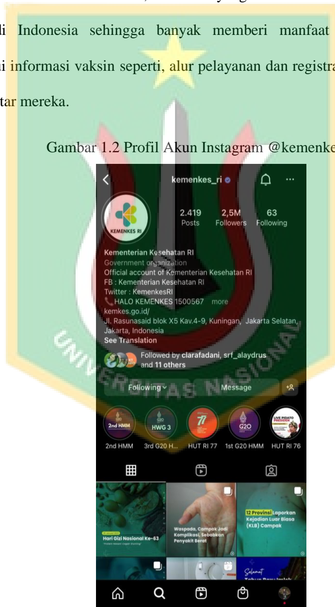
Gambar 1.2 Profil Akun Instagram @kemenkes_ri