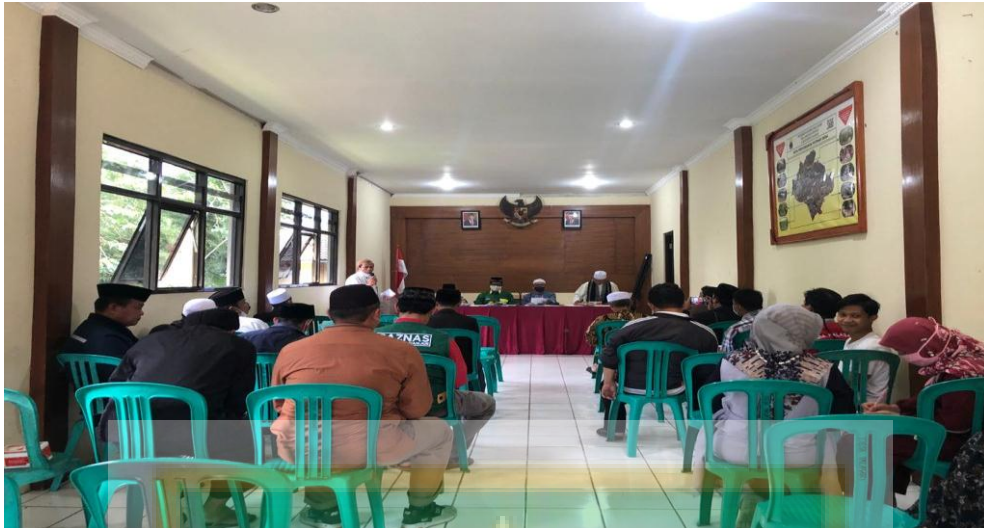
Suasana penyaluran BST di desa Palasari berjalan kondusif