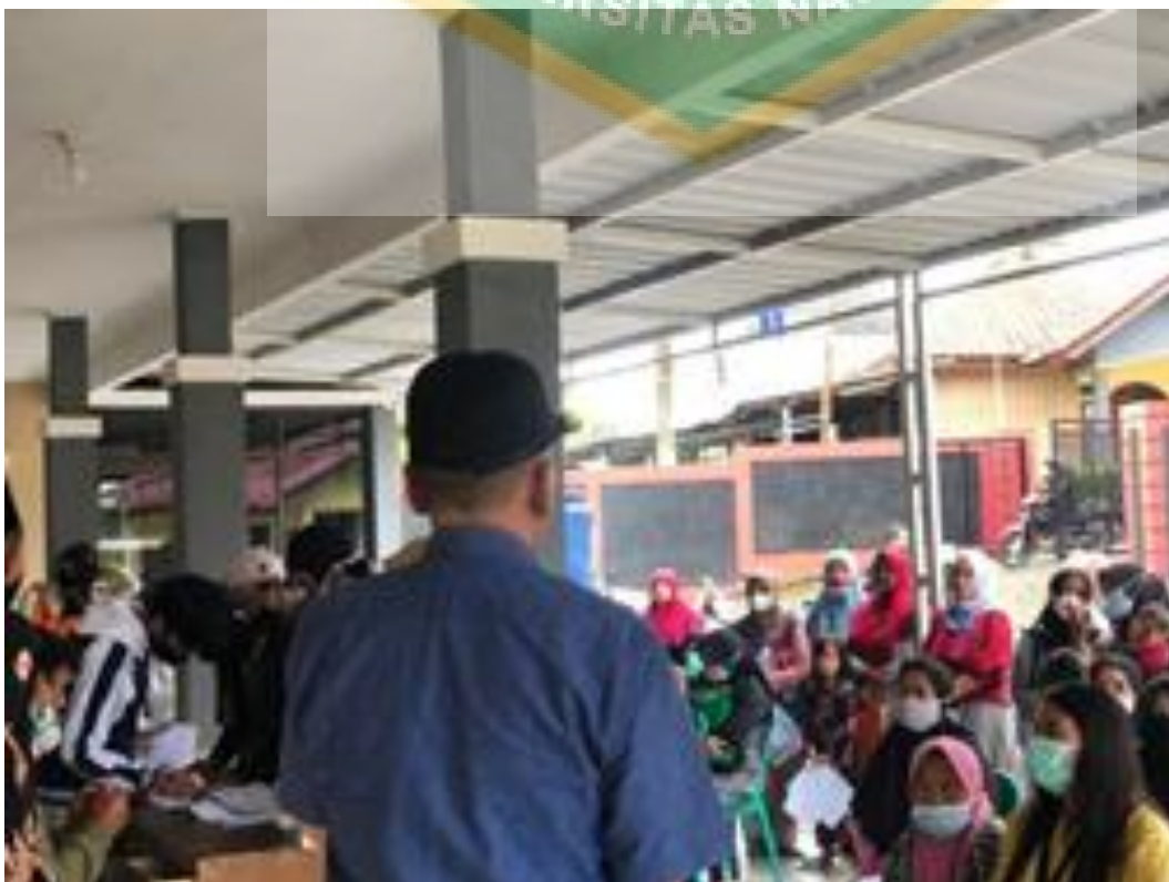
Warga penerima BST di Desa Palasari