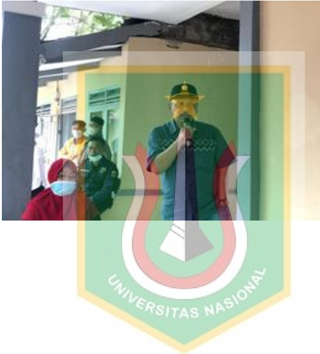
Sosialisai Kepala Desa kepada warga penerima BST