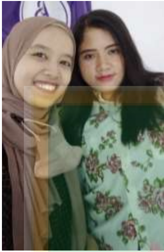
Wawancara dengan Ibu Ayu selaku pembeli atau Masyarakat setempat,2022