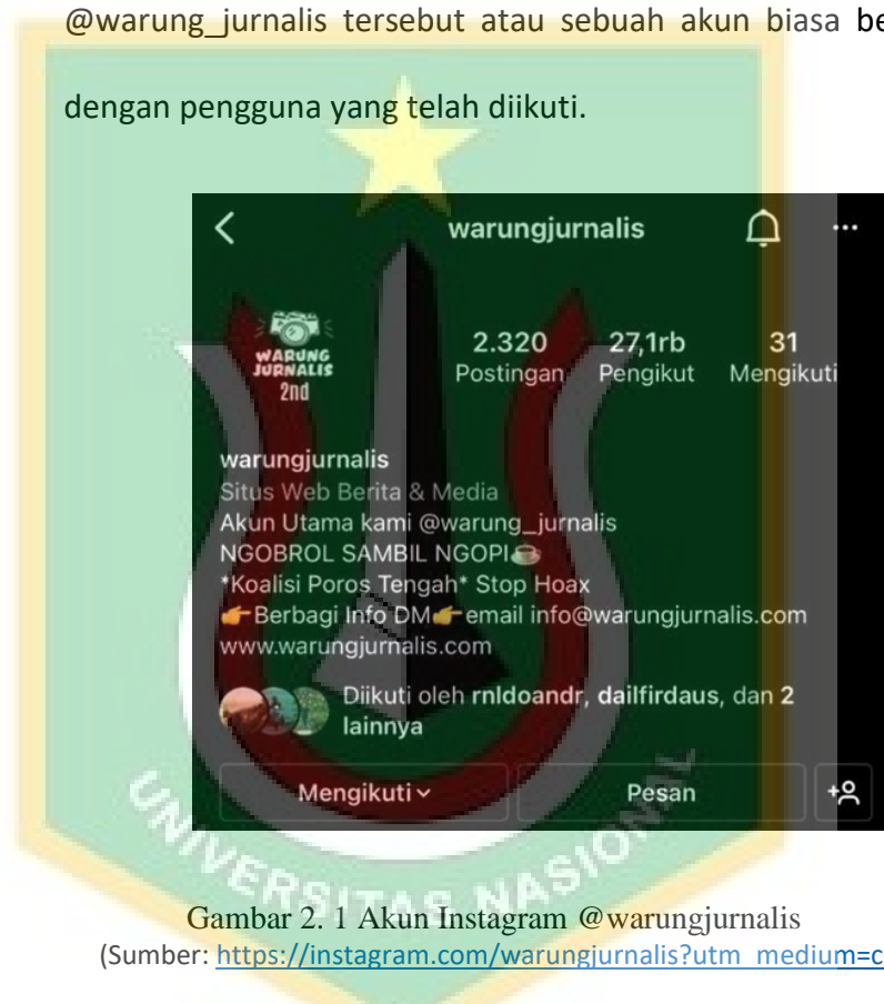
Gambar 2. 1 Akun Instagram @warungjurnalists

Sebagai contoh, unggahan dalam caption diberi hastag #warungjurnalists, lingkupan yang ada dari interaksi yang dilakukan @warung_jurnalists tersebut atau sebuah akun biasa berinteraksi dengan pengguna yang telah diikuti.