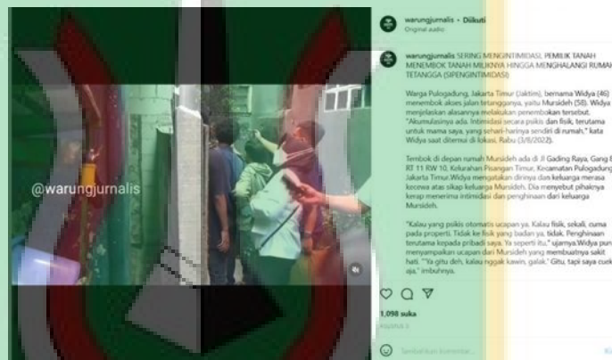
Gambar 2.3 Contoh Berita Megapolitan