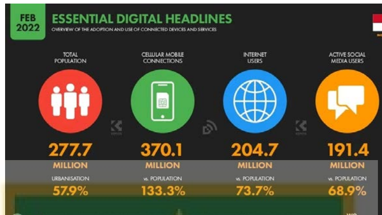
Gambar 1. 1 Populasi Pengguna Sosial Media