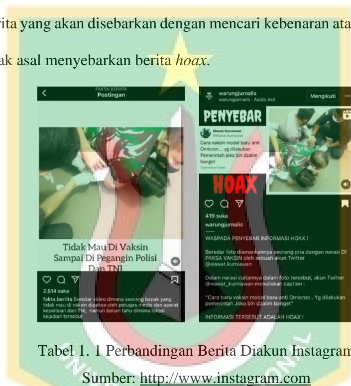
Tabel 1. 1 Perbandingan Berita Diakun Instagram

memegang salah satu warga yang tidak mau divaksin. Tanpa mengetahui informasi yang jelas akun Instagram berita itu menyebarkan. Sedangkan @warungjurnalis mengklarifikasi berita tersebut dengan jelas. Video yang viral itu adalah orang dalam gangguan jiwa (ODGJ) yang kerap meresahkan warga sekitar. Dalam hal ini, @warungjurnalis terbukti menjaga kualitas berita yang akan disebar dengan mencari kebenaran atas suatu berita dan tidak asal menyebarkan berita hoax .