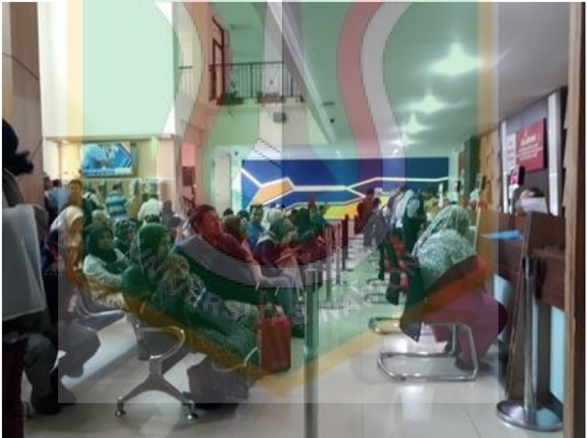
Antrean Loket Masyarakat