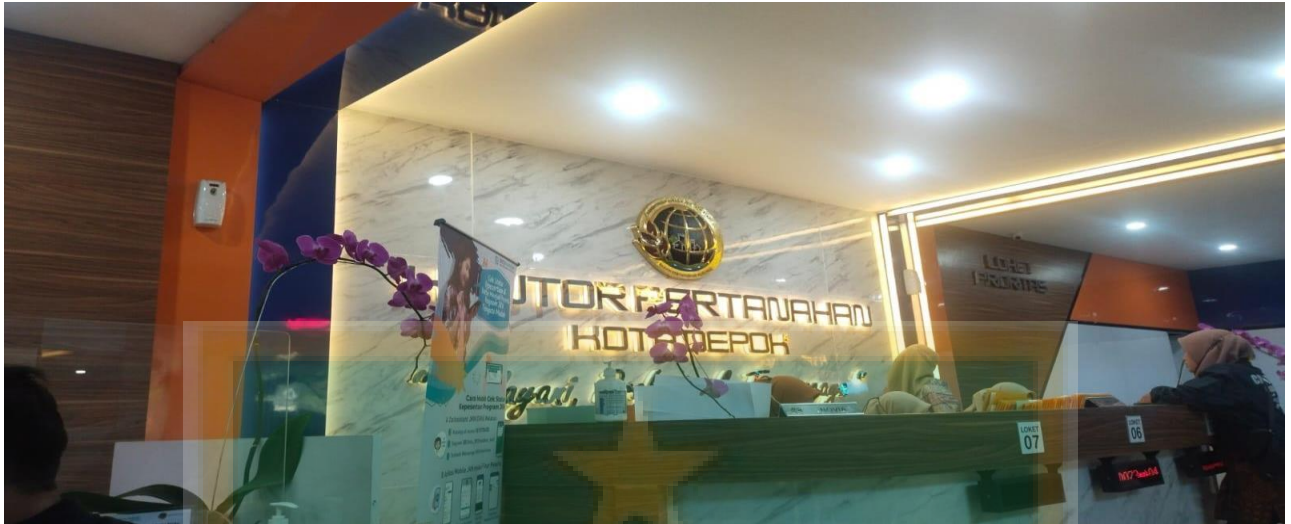
Loket Pelayanan Badan Pertanahan Kota Depok