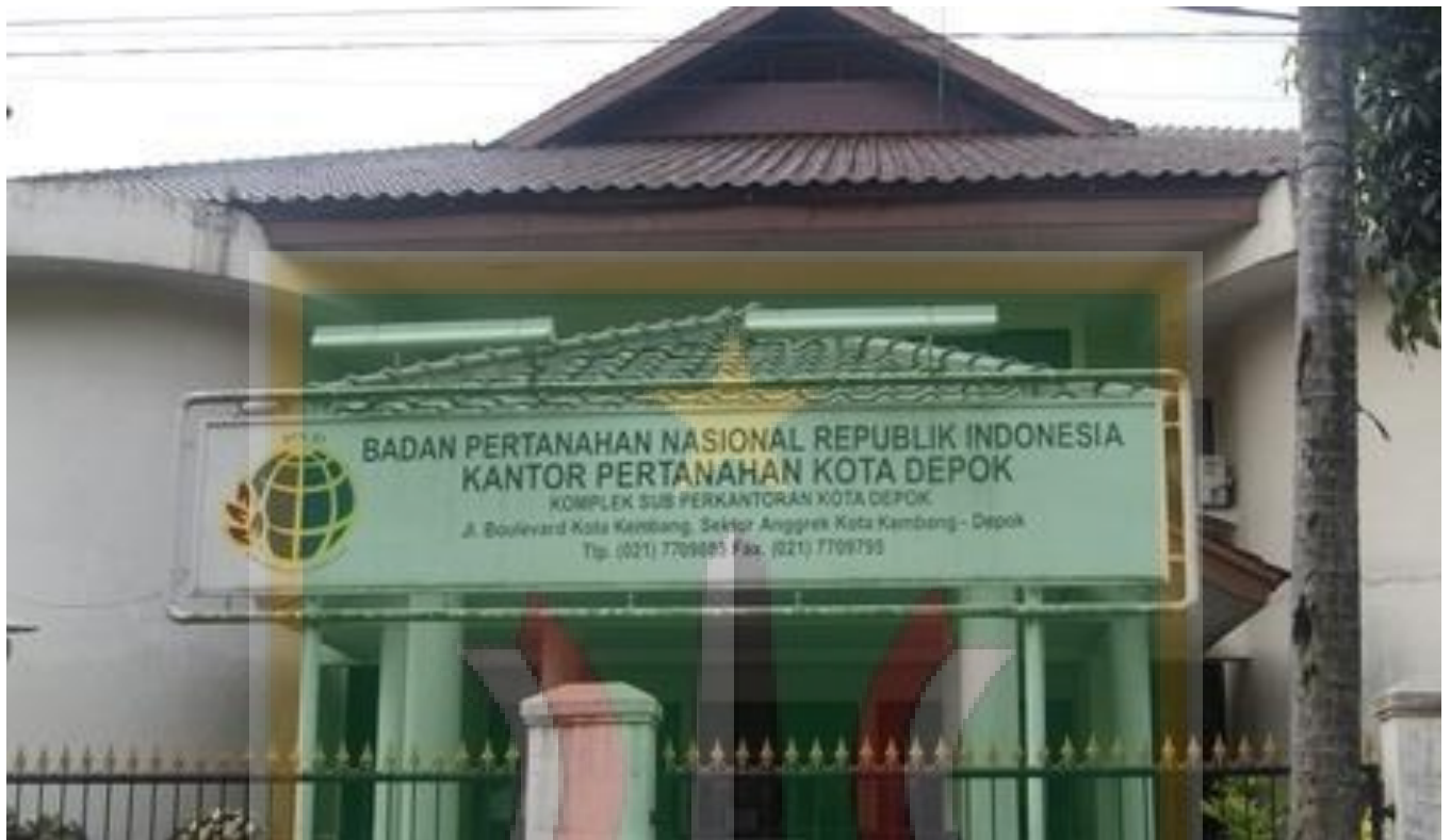
Kantor Badan Pertanahan Kota Depok