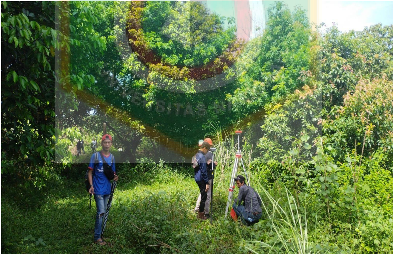
Pengecekan Lokasi Bersama Petugas Ukur