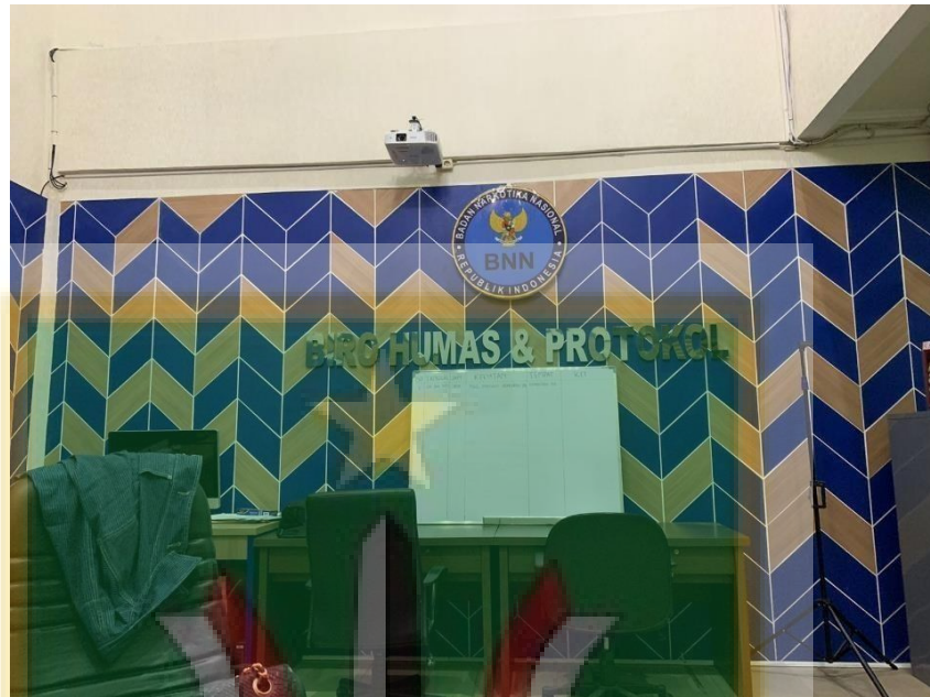
Gambar 1. Ruang Biro Humas dan Protokol