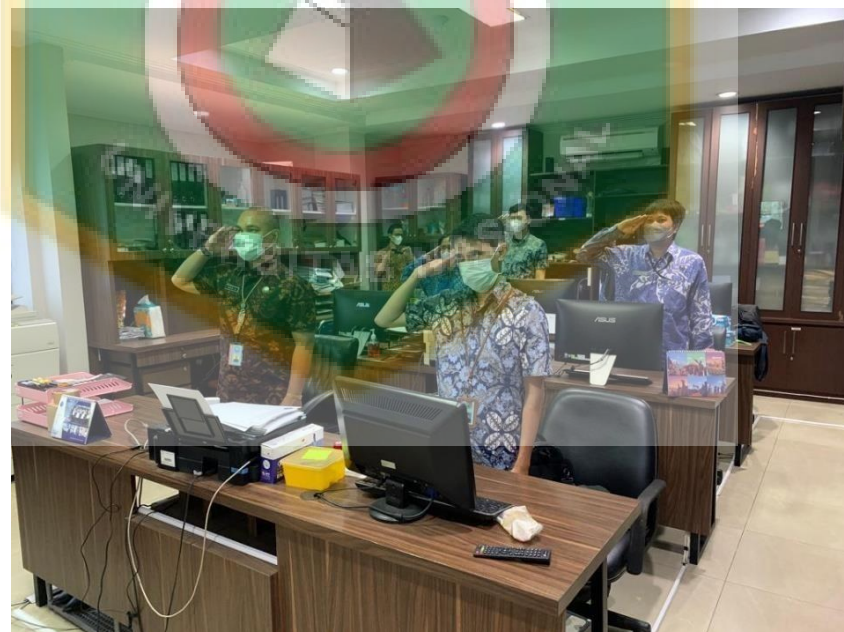
Gambar 2. Ruang Staff dan Karyawan Humas