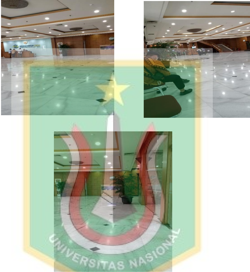
Lobby depan kantor Kementerian Koperasi dan UKM