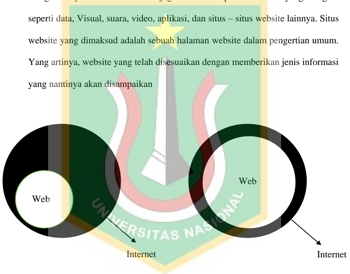
Gambar 2.1 Konvergensi Web dengan Internet

Website merupakan sebuah situs yang membutuhkan jaringan internet untuk mengaksesnya. Di dalam Website juga berisikan seputar informasi yang beragam seperti data, Visual, suara, video, aplikasi, dan situs – situs website lainnya. Situs website yang dimaksud adalah sebuah halaman website dalam pengertian umum. Yang artinya, website yang telah disesuaikan dengan memberikan jenis informasi yang nantinya akan disampaikan