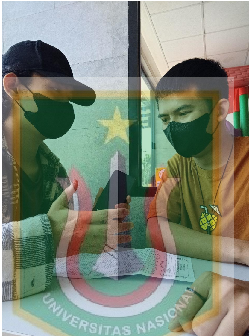
Dokumentasi penulis dengan informan selaku Sosial Admin Paguyuban Mojang Jajaka Kabupaten Bogor Periode 2020/2022