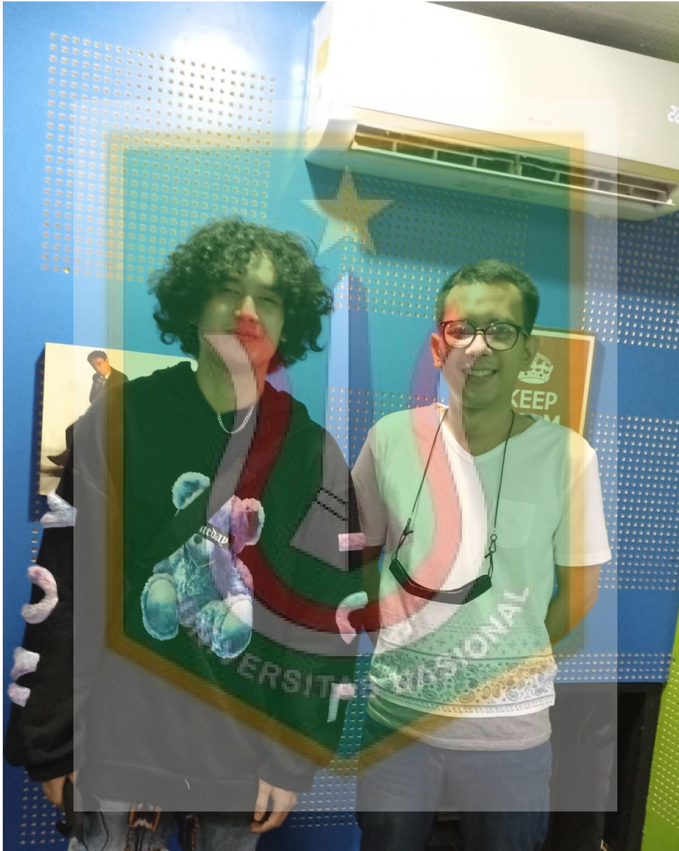
Dokumentasi penulis dengan key informan selaku Ketua Paguyuban Mojang Jajaka Kabupaten Bogor Periode 2020/2022