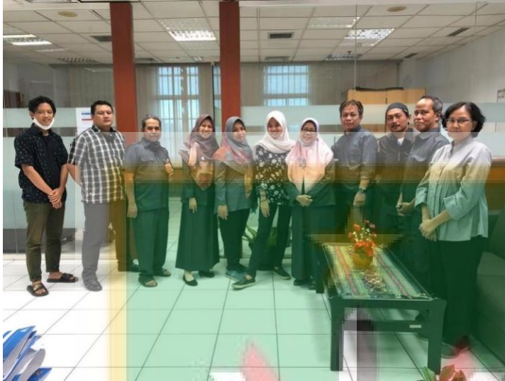
Foto bersama setelah magang dan wawancara