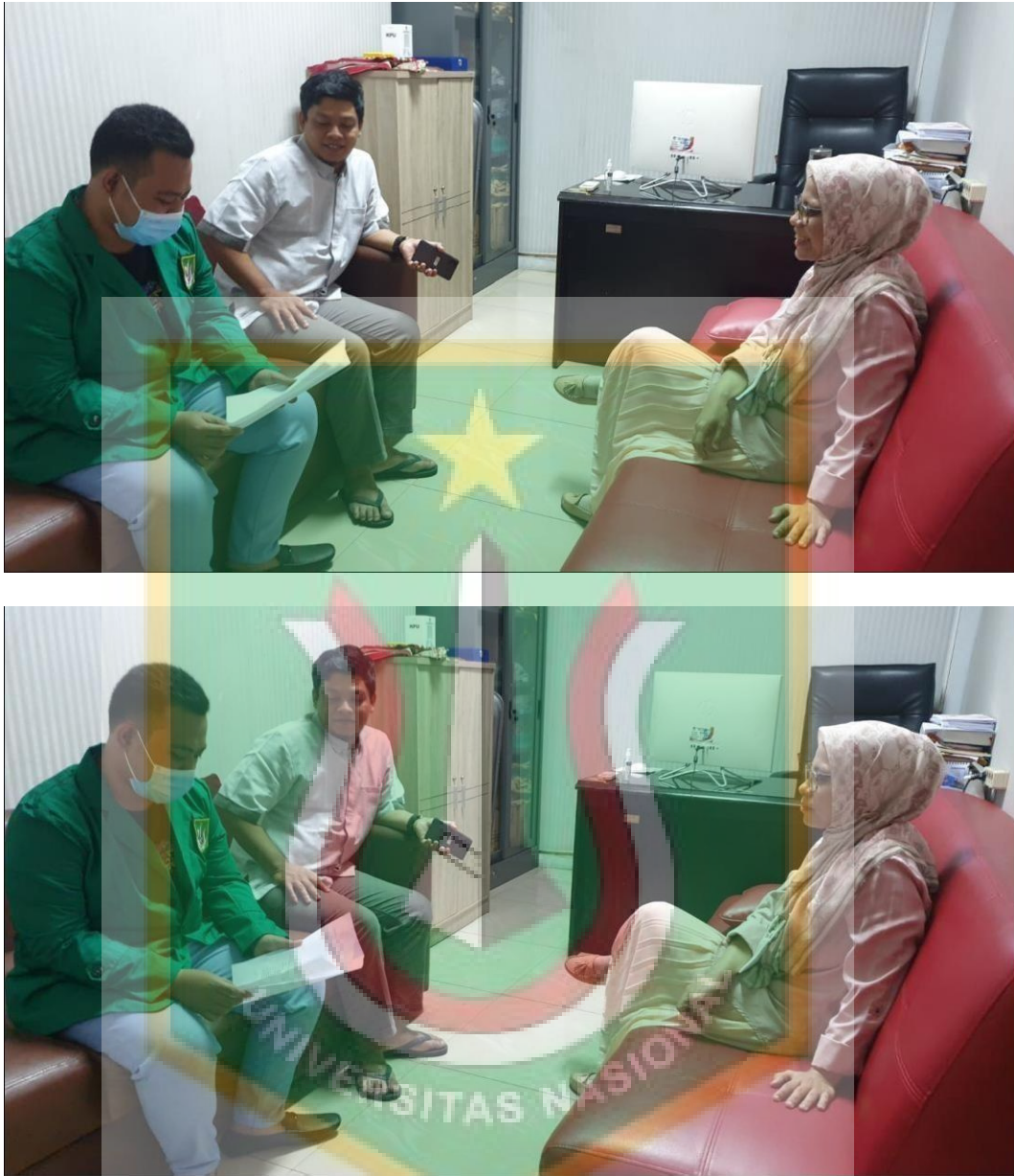
Bersama Ibu Fitri