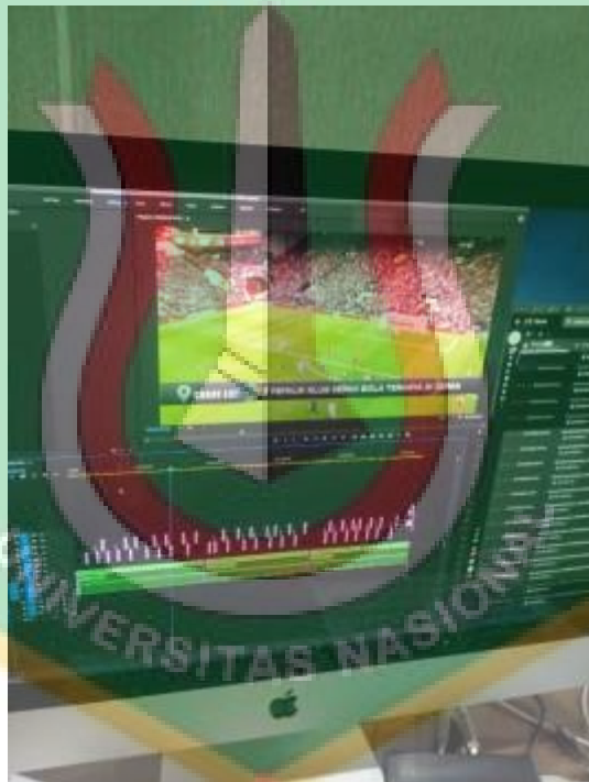
Proses pengeditan Program Share Loc