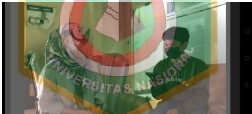
Wawancara dengan Informan 1 oleh Nur faizah