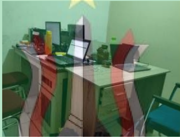
Ruang produksi Nusantara TV