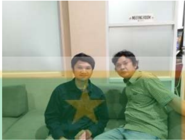
Wawancara bersama key informan di depan ruang meeting Nusantara TV Tanggal 8 juni 2022