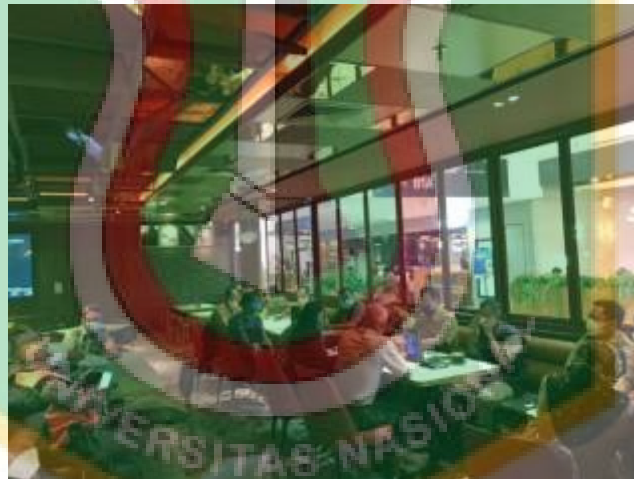
Gambar rapat koordinasi tinjau lapangan saat lokasi outdoor/mall.