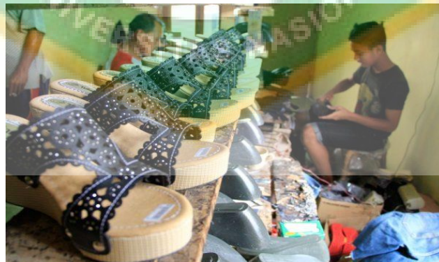
Gambar 5 : Pengrajin Sandal Desa Kotabatu