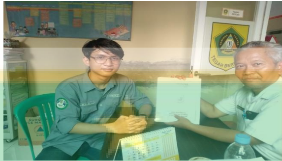
Gambar 3 : Foto Dengan SEKDES Desa Kotabatu