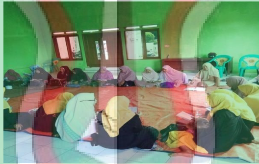
Gambar 4 : Pengajian Rutin Ibu-Ibu