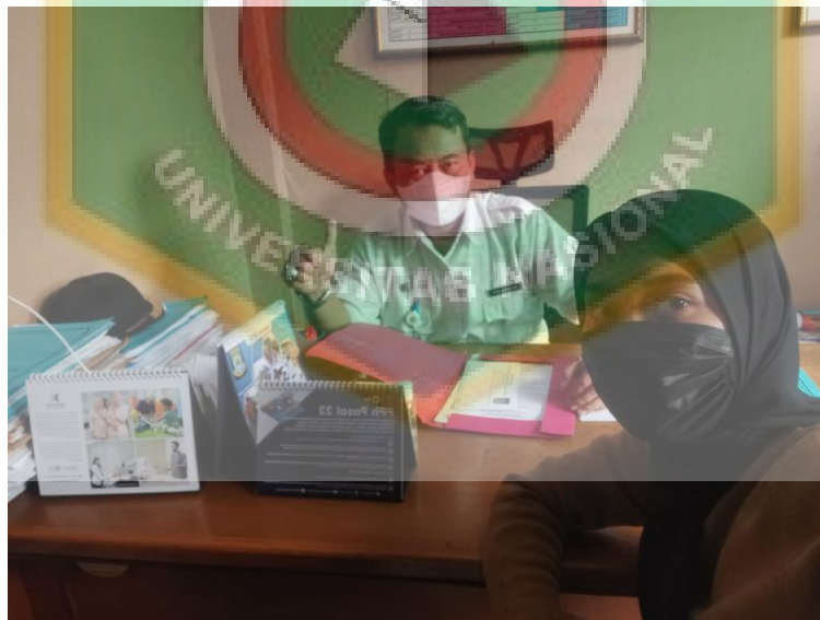
Foto Dengan Sekertaris Kelurahan Kunciran Indah Pada Saat Izin Melakukan Penelitian