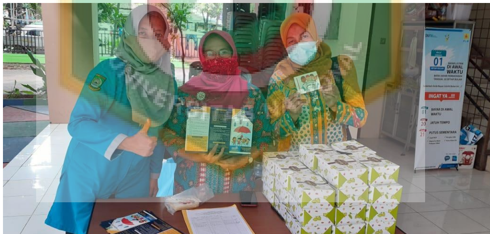
Kegiatan Sosialisasi PATBM di Kelurahan Kunciran Indah Kecamatan Pinang Kota Tangerang