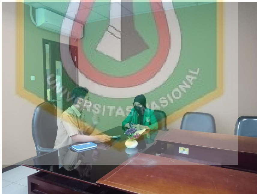
Foto Dengan Kepala Seksi Perlindungan Perempuan dan Anak DP3AP2KB Kota Tangerang Pada Saat Wawancara