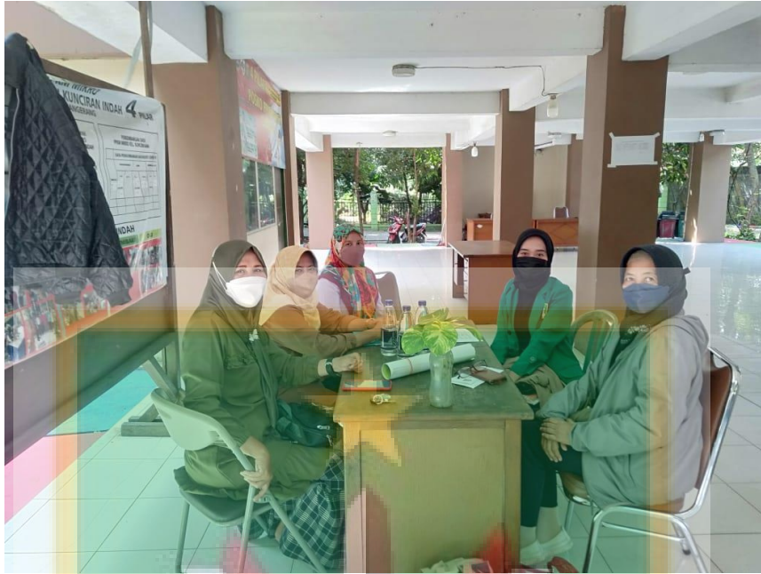
Wawancara Bersama Ketua PATBM, Aktivis, dan Masyarakat Bertempat di Kelurahan Kunciran Indah