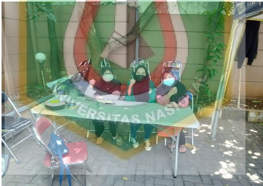
Foto Sesudah Wawancara Bersama Ibu Siti halimah & Niaharyanti (masyarakat yang merasakan manfaat adanya program PATBM)