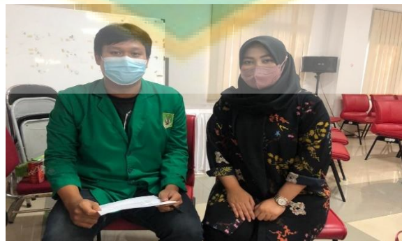
Ibu Honesty (Binaan Jakpreneur Kecamatan Makasar)