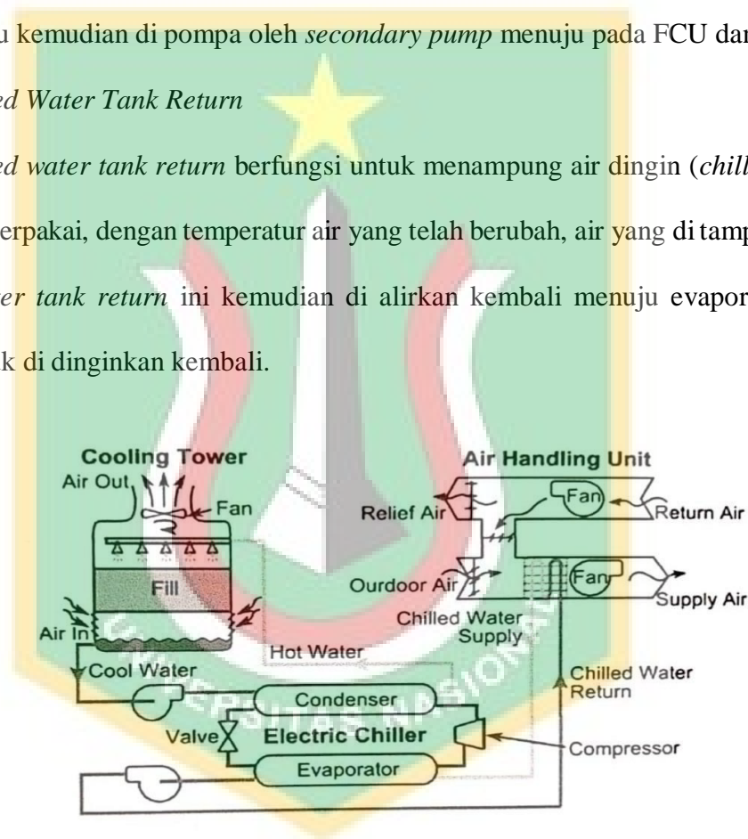
Gambar 2.2 Proses siklus penyerapan kalor dan pelepasan kalor pada mesin chiller

Chilled water tank return berfungsi untuk menampung air dingin ( chilled water ) yang telah terpakai, dengan temperatur air yang telah berubah, air yang di tampung pada chilled water tank return ini kemudian di alirkan kembali menuju evaporator pada chiller untuk di dinginkan kembali.