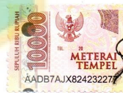
Nabila Salsa Putriyanto