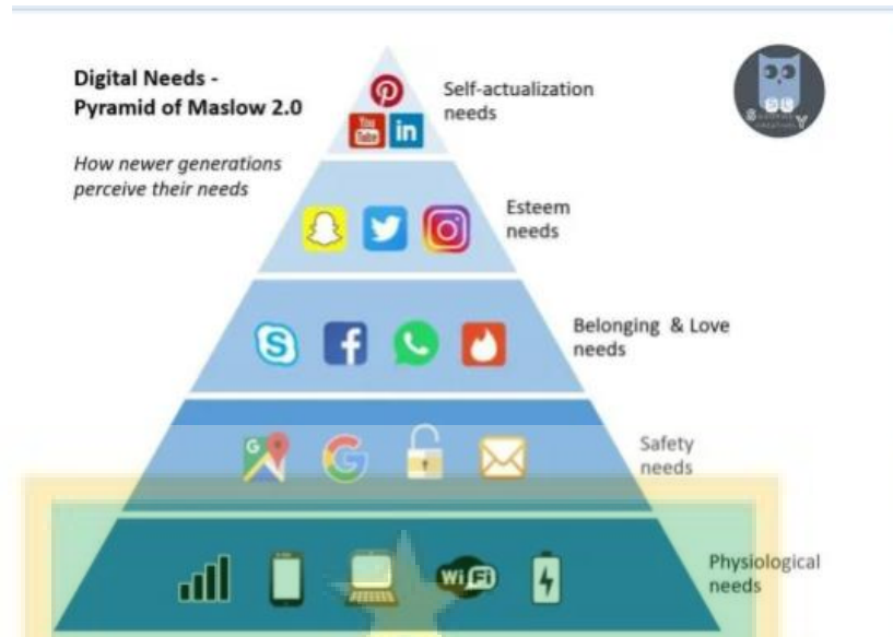
Diagram 2.3.4.1 Hierarki Kebutuhan Digital Maslow