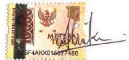
Alika Nur Izzati