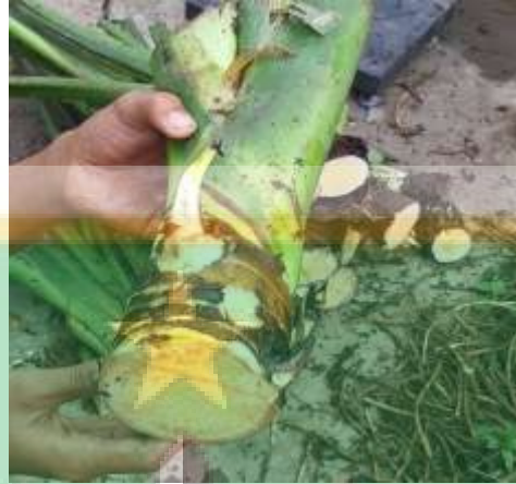
Gambar 2. Batang Talas Beneng.

bulat dengan jarak masing-masing ruas yang sangat pendek atau sempit. Batang pada tanaman talas tumbuh tegak ke arah atas. Batang talas beneng dapat dilihat pada Gambar 2.