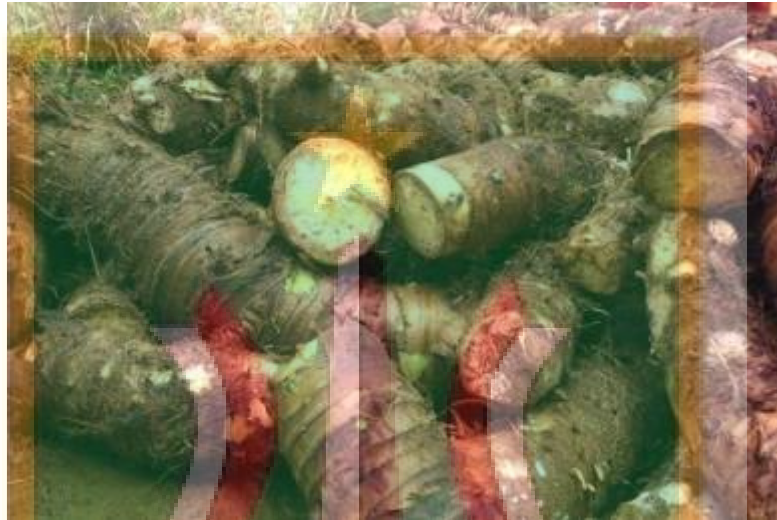
Gambar 4. Umbi Talas Beneng.

Daging umbi talas beneng berwarna kuning, memiliki ukuran yang besar dan panjang serta pada bagian akarnya terdapat umbi-umbi kecil (kimpul) yang bergerombol. Selain kimpul, bagian utama yang dapat dikonsumsi adalah akar (Kementrian Pertanian Badan Litbang Pertanian, 2016). Gambar umbi talas beneng dapat dilihat pada Gambar 4.