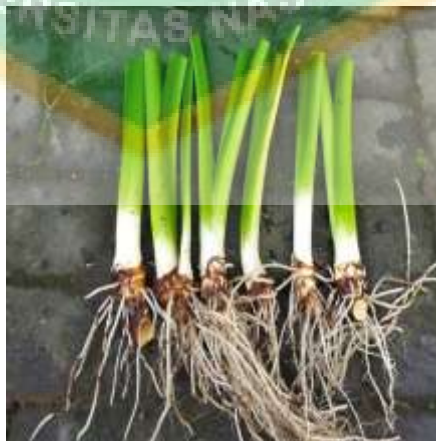
Gambar 3. Akar Talas.

Tanaman talas merupakan tanaman yang memiliki sistem perakaran serabut yang tersusun dari perakaran adventif, dengan tumbuh tegak mencapai kedalaman lebih dari 10-20 cm. Akar utama talas beneng dapat mencapai panjang 120 cm dengan bobot 42 kg dengan ukuran lingkaran luar 500 cm saat mencapai umur lebih dari dua tahun. Bagian inilah yang biasa diolah menjadi tepung talas beneng (Kementrian Pertanian Badan Litbang Pertanian, 2016). Gambar akar talas beneng dapat dilihat pada Gambar 3.