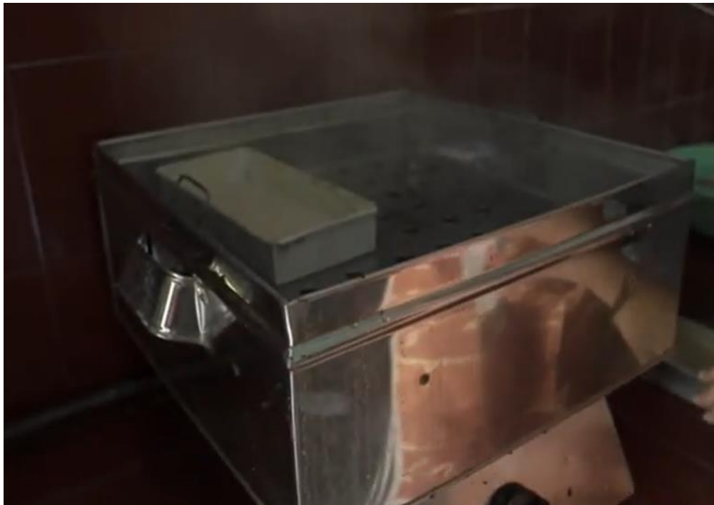
Gambar 9. Pengukusan Brownies Ubi Jalar