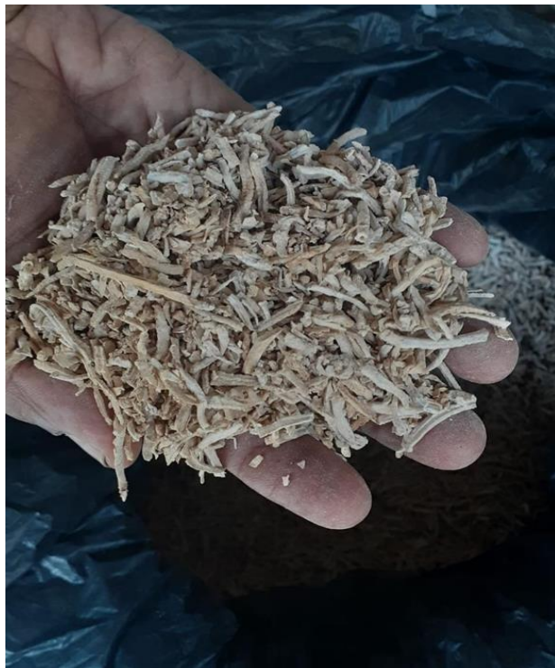
Gambar 17. Irisan Ubi Jalar yang Telah dij