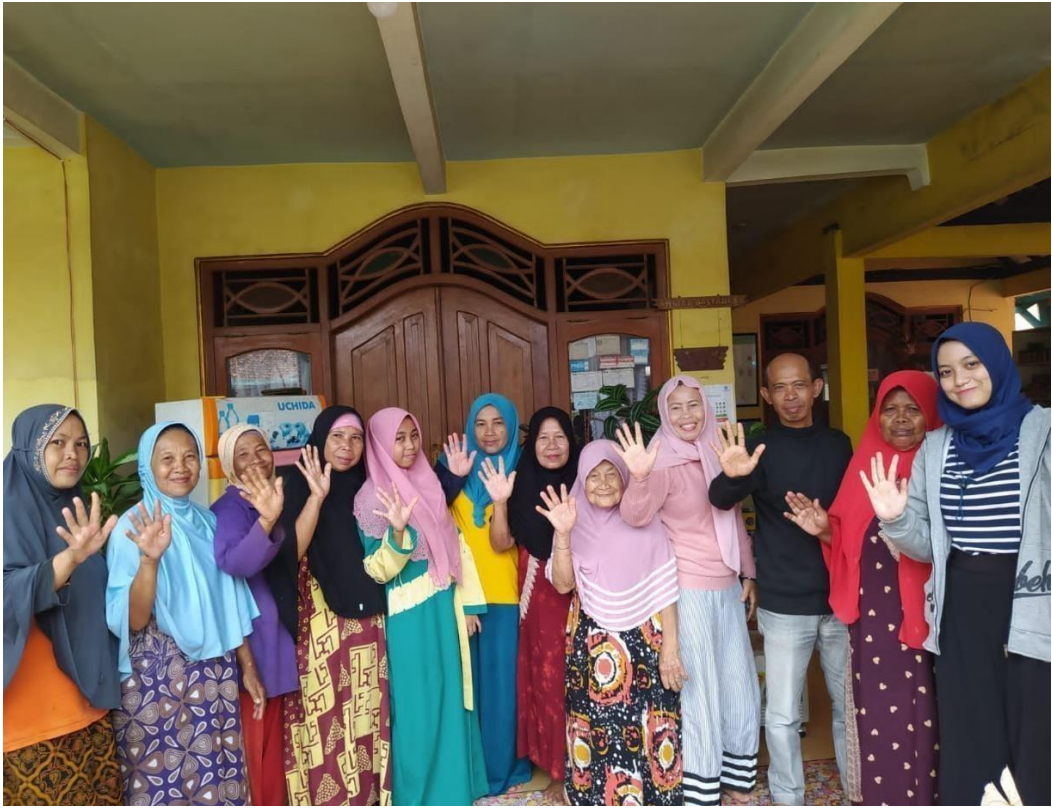
Gambar 12. Foto Bersama Anggota KWT Melati dan juga Ketua Gapoktan Mandiri Jaya