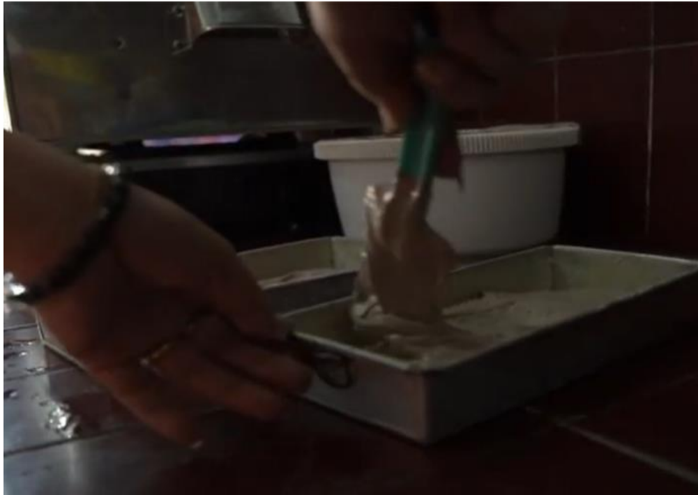
Gambar 8. Pencetakan Adonan Brownies Ubi Jalar