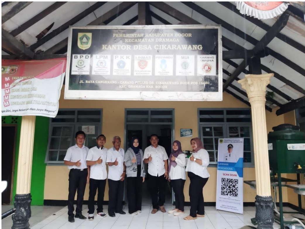
Gambar 14. Foto Bersama Pegawai Kantor Desa Cikarawang