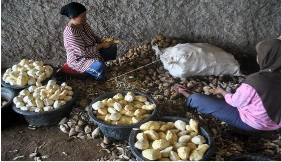
Gambar 1. Pengupasan Hasil Panen Ubi Jalar dari Petani