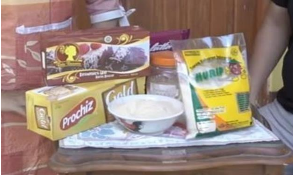
Gambar 4. Bahan Membuat Brownies Ubi Jalar