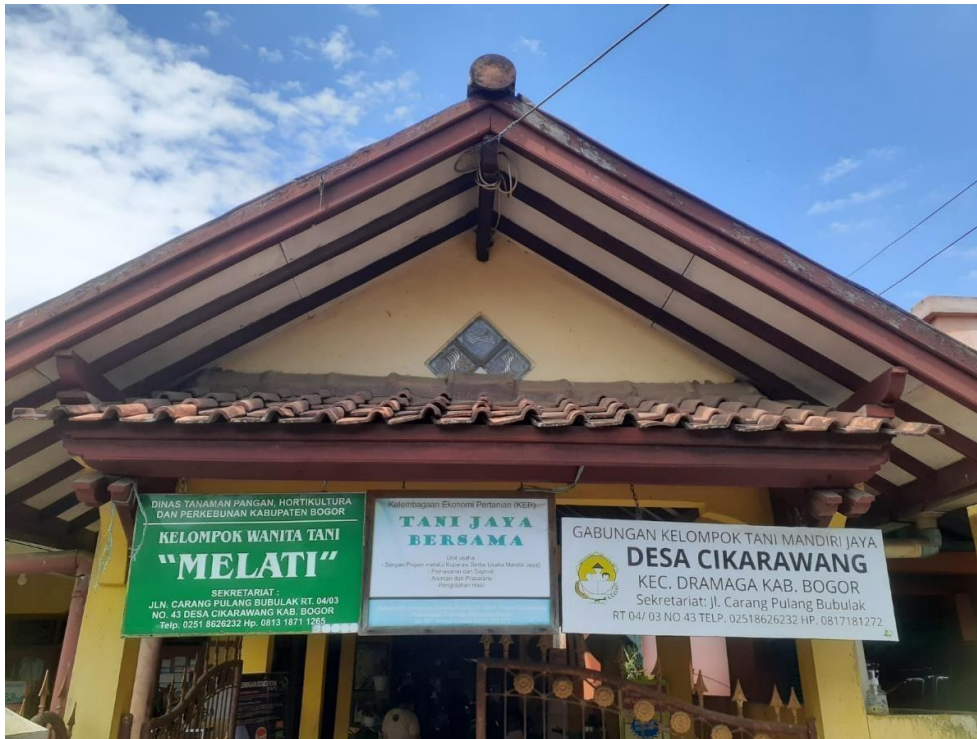
Lampiran 3. Rumah Ketua KWT Melati dan Ketua Gapoktan Mandiri Jaya