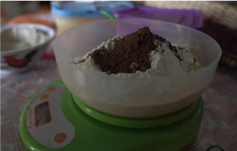
Gambar 5. Penimbangan Tepung Ubi Jalar dan Cokelat Bubuk