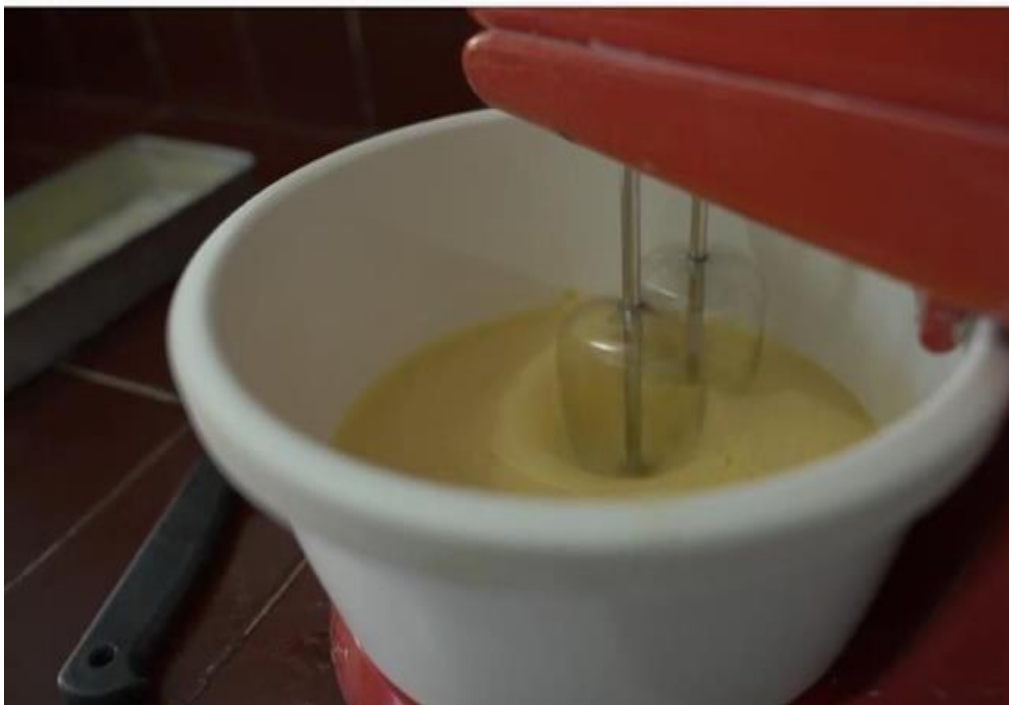
Gambar 7. Proses Pengadukan semua Bahan