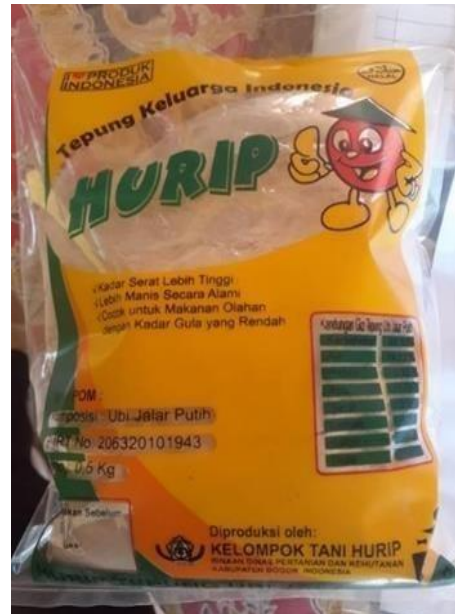
Gambar 3. Pengemasan Tepung Ubi Jalar Setelah digiling