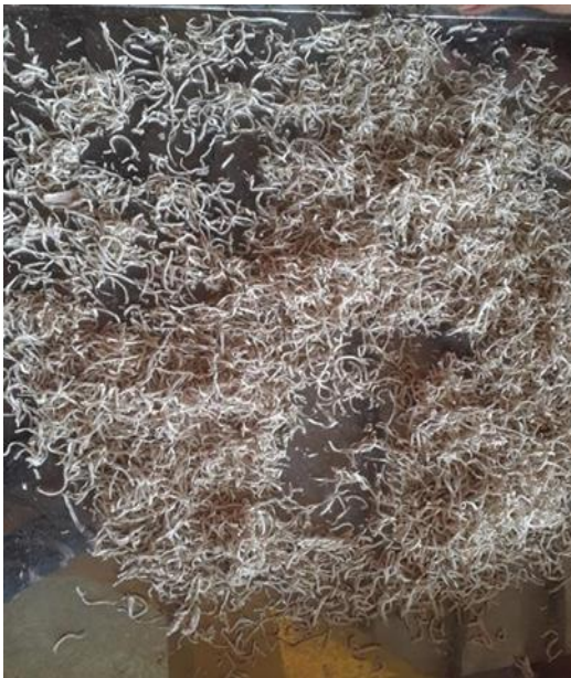
Gambar 2. Irisan Ubi Jalar Setelah dijemur