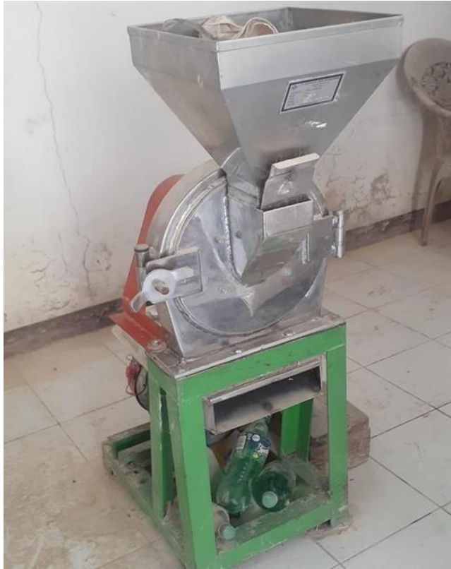
Gambar 18. Alat Penggiling Tepung Ubi Jalar