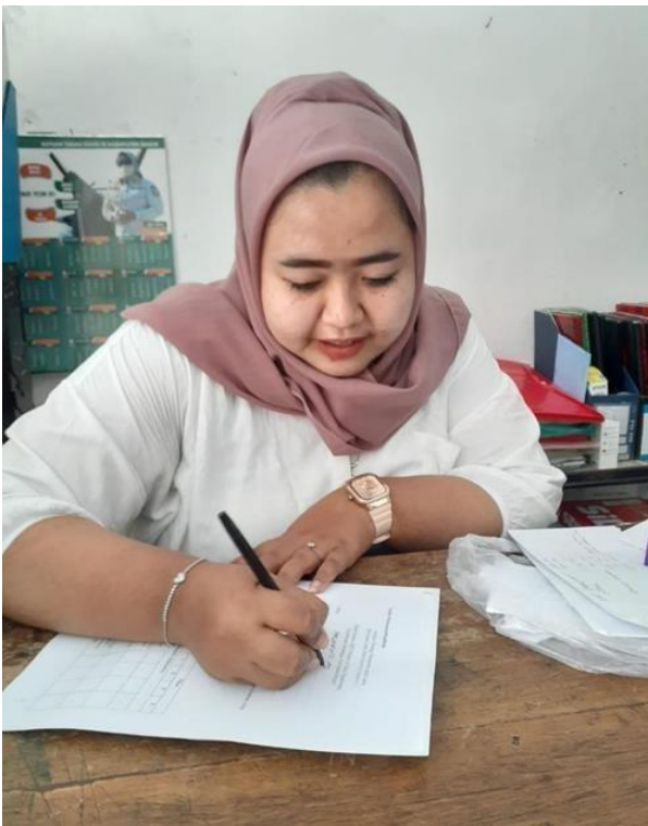
Gambar 13. Pengisian Kuesioner di Kantor Desa Cikarawang