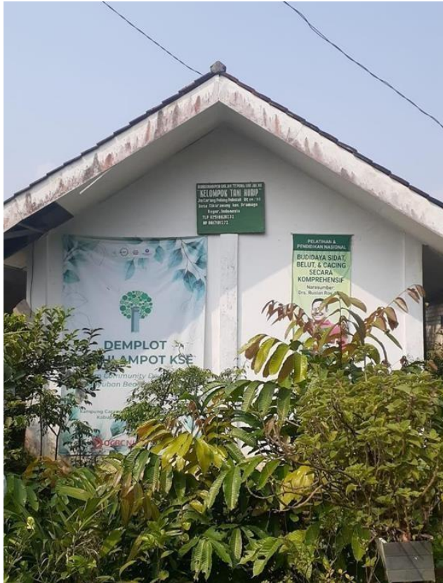
Gambar 16. Tempat Pembuatan Tepung Ubi Jalar