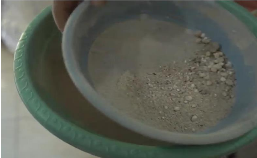
Gambar 6. Pengayakan Tepung Ubi Jalar dan Cokelat Bubuk