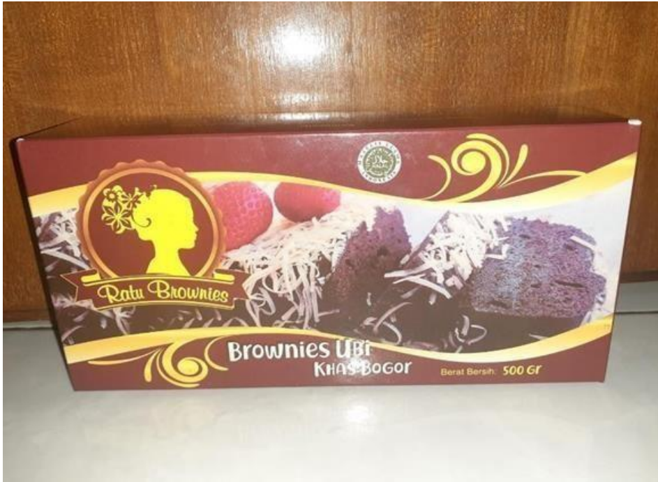
Gambar 10. Brownies Ubi Jalar yang Telah dikemas