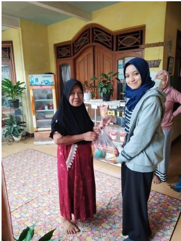
Gambar 15. Pemberian Cenderamata Kepada Responden