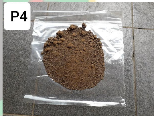
Gambar contoh tanah yang diambil dari Dusun Tunggul