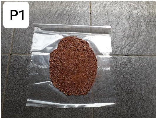
Gambar contoh tanah yang diambil dari Dusun Lemahbang