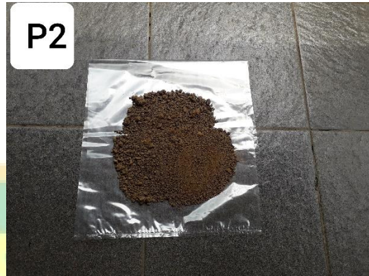
Gambar contoh tanah yang diambil dari Dusun Belah