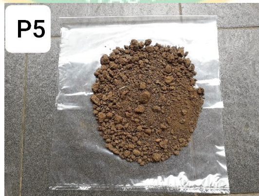
Gambar contoh tanah yang diambil dari Dusun Bayem