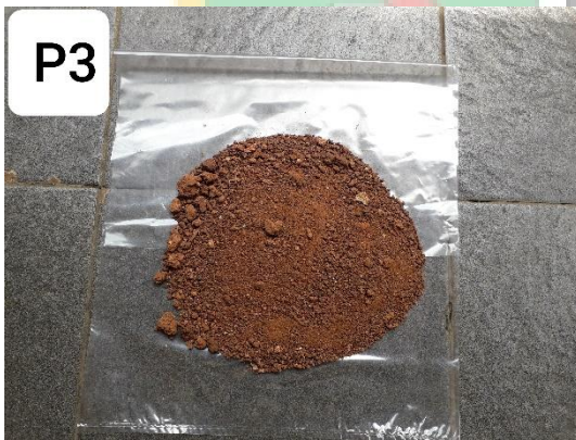
Gambar contoh tanah yang diambil dari Dusun Jatisari