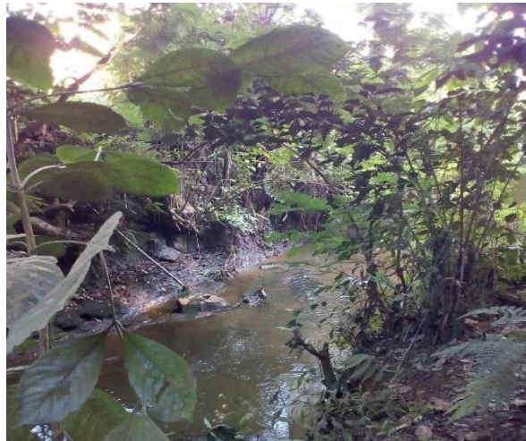
Gambar 4. Kondisi perairan daerah hilir