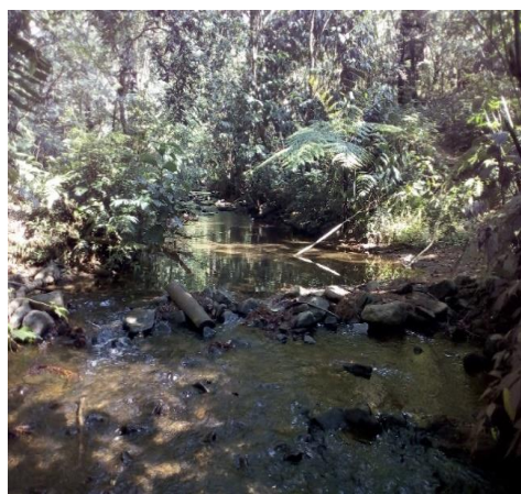
Gambar 3. Kondisi perairan daerah tengah