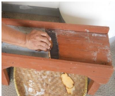
Gambar 3 . Pengirisan umbi iles-iles secara manual

Petani di desa Klangon pada umumnya melakukan pengirisan (perajangan) umbi iles-iles masih secara manual (Gambar 3). Pengirisan secara mekanis dilakukan hanya pada tingkat pengepul yang jumlahnya satu buah di Dusun Klangon. Pengirisan umbi iles-iles secara manual ini menghasilkan chips yang tebalnya tidak sama yaitu antara 5-10 mm dan kurang efisien.