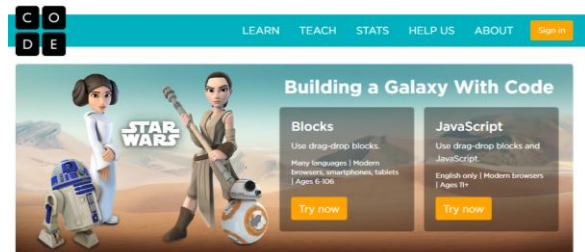
Gambar 1. Halaman utama pada web code.org

peserta didik sesuai dengan kesukaannya. Games di ke dua web tersebut sudah di desain sesuai dengan intruksional pembelajaran dimulai dari yang paling mudah, hingga yang paling sulit, disertai dengan soal-soal yang dapat kerjakan dengan bentuk yang sangat menarik minat peserta didik.