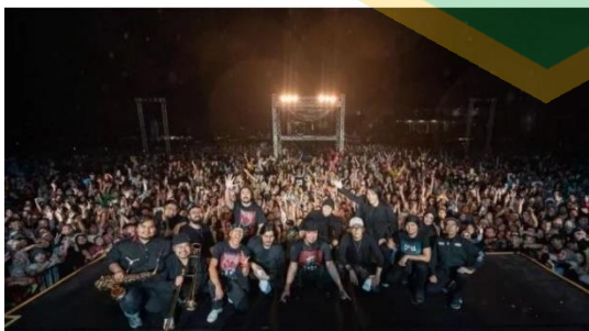
Konser Dewa 19 di JIS

oleh Henry diperbarui 06 Feb 2023, 21:13 WIB