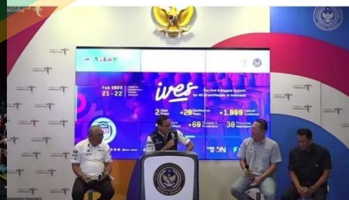
Menpaekraf Sandiaga Uno di The Weekly Bried with Sandi Uno, Senin, 6 Februari 2023.