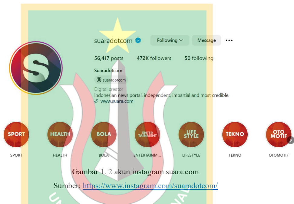
Gambar 1. 2 akun instagram suara.com

Sebuah studi yang dilakukan (Budiarti & Yanuar, 2022) mengenai "Strategi Pemasaran melalui Media Sosial dalam Meningkatkan Brand Awareness" menyoroti pentingnya penggunaan media sosial dalam memperkuat brand awareness sebuah perusahaan. Studi ini menunjukkan bahwa media sosial dapat menjadi alat yang efektif dalam meningkatkan kesadaran konsumen terhadap merek tertentu. Hal ini menunjukkan bahwa merancang pengelolaan Instagram yang tepat sangat penting untuk mencapai tujuan tersebut.