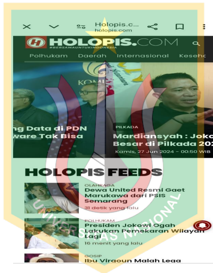
Gambar 1. 1 Screenshot tampilan beranda Holopis.com

Dalam 3 tahun terakhir, Menurut laporan We Are Social, jumlah pengguna internet di Indonesia telah mencapai 213 juta orang per Januari 2023. Jumlah ini setara 77% dari total populasi Indonesia yang sebanyak 276,4 juta orang pada awal tahun ini. Jumlah pengguna internet di Tanah Air naik 5,44% dibandingkan tahun sebelumnya ( year-on-year/yoy ). Pada Januari 2022, jumlah pengguna internet di Indonesia baru sebanyak 202 juta orang (Cindy Mutia Annur 2023). Dari data di atas terlihat bahwa masyarakat Indonesia sangat menyukai mengakses media online.