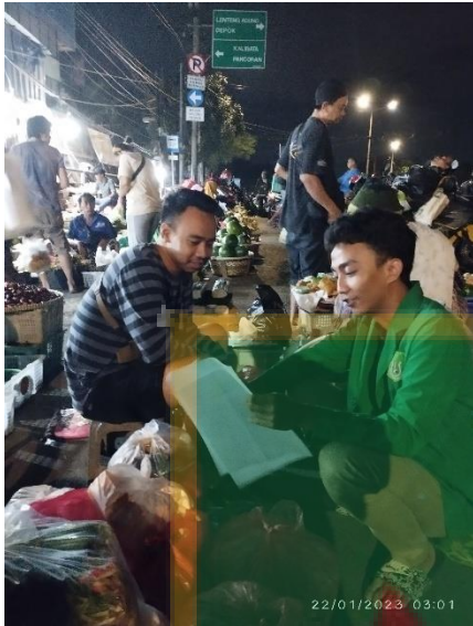
Gambar 3 Wawancara Abang Elang Bondol PKL