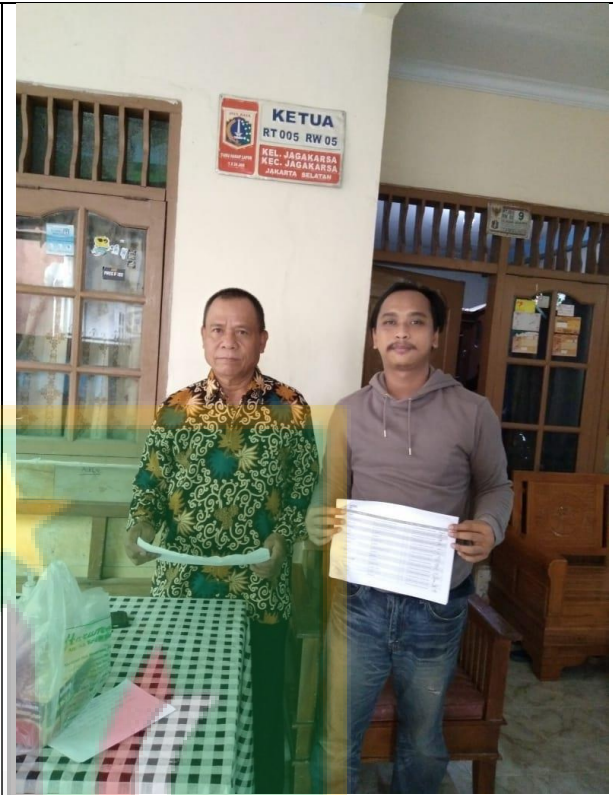
Gambar foto dengan Ketua RT 05 Jagakarsa