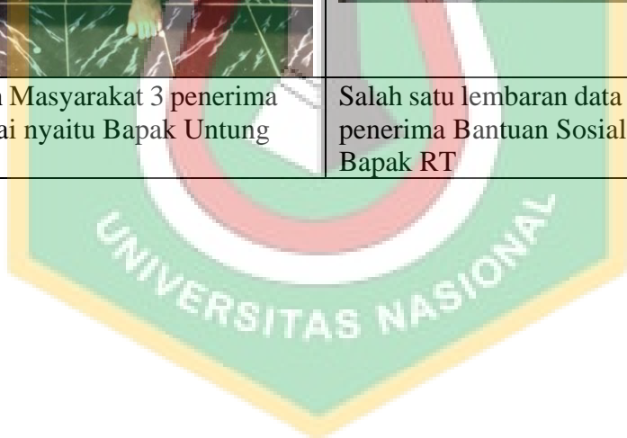
Salah satu lembaran data nama-nama penerima Bantuan Sosial Tunai dari Bapak RT