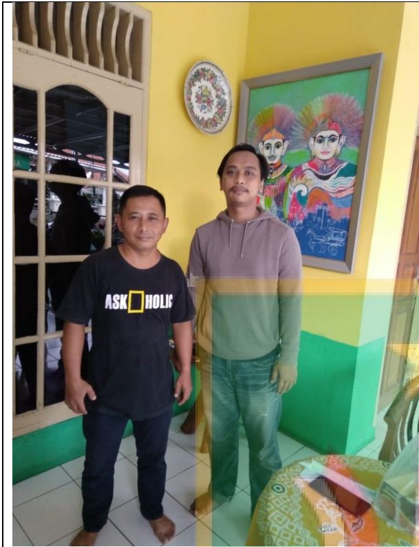
Gambar foto dengan Ketua RW 005 Jagakarsa