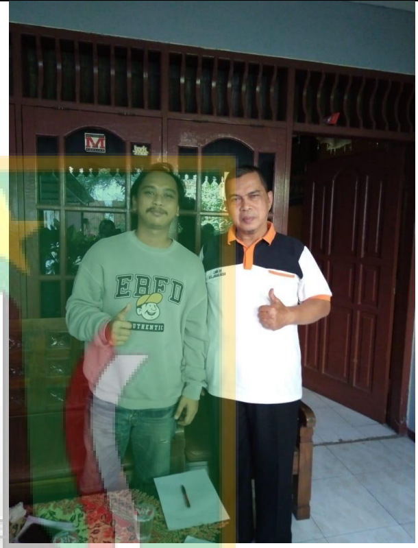
Gambar foto dengan Dewan Kelurahan Jagakarsa