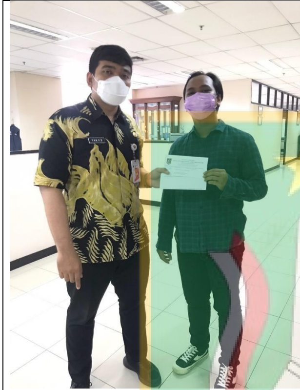
Gambar foto dengan Staf Suku Dinas Sosial Jakarta Selatan