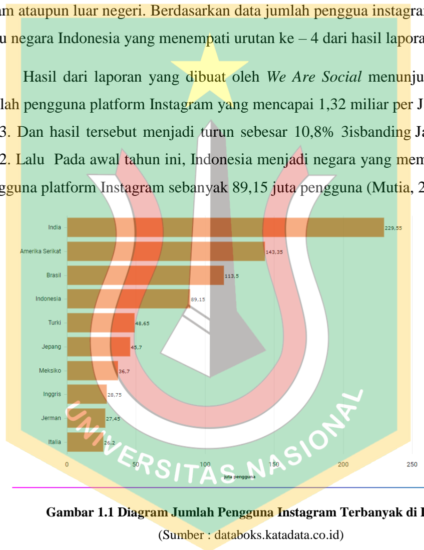
Gambar 1.1 Diagram Jumlah Pengguna Instagram Terbanyak di Dunia

Hasil dari laporan yang dibuat oleh We Are Social menunjukkan bahwa jumlah pengguna platform Instagram yang mencapai 1,32 miliar per Januari tahun 2023. Dan hasil tersebut menjadi turun sebesar 10,8% 3isbanding Januari tahun 2022. Lalu Pada awal tahun ini, Indonesia menjadi negara yang memiliki jumlah pengguna platform Instagram sebanyak 89,15 juta pengguna (Mutia, 2023)