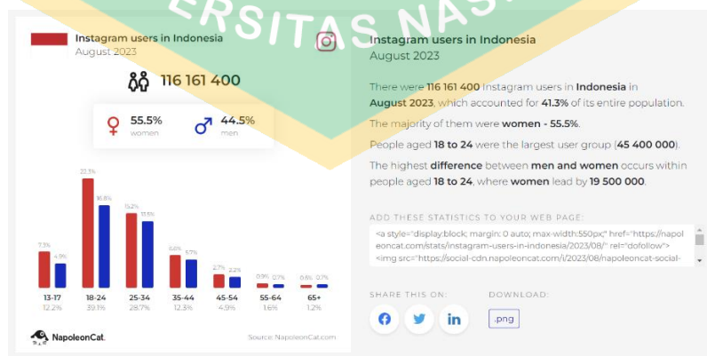
gambar 1. 2 Pengguna instagram di Indonesia

Berdasarkan Kataboks.katadata.co.id pada permulaan tahun ini, Indonesia menempati peringkat ke-4 sebagai negara dengan jumlah pengguna instagram terbanyak di dunia dengan 89,15 juta pengguna (Annur, 2023). Menurut data dari Napoleon Cat, hingga bulan Agustus 2023 terdapat sekitar 116,16 juta pengguna instagram di Indonesia. Jumlah tersebut mengalami kenaikan sekitar 6,54%. Dibandingkan dengan bulan sebelumnya, dimana terdapat sekitar 109,03 juta pengguna. Perempuan mendominasi pengguna instagram di Indonesia, mencapai presentase sebesar 55,5%. Di samping itu, sekitar 44,5% pengguna instagram digunakan oleh laki-laki (Rizaty, 2023).