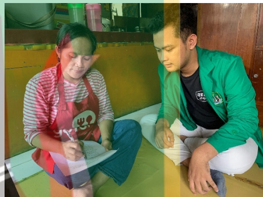
Foto bersama responden