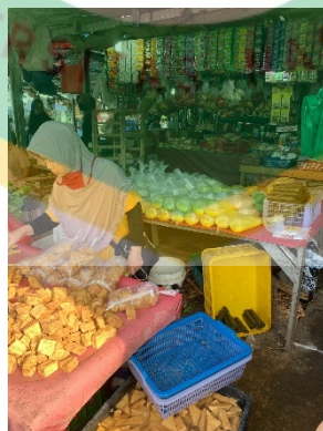
Foto toko penjual sayuran skala kecil