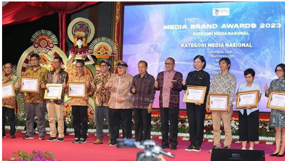
Gambar 1.3 Penghargaan Tempo 2023

Jumat 11 Agustus 2023 sebagai brand media nasional yang paling banyak ditampilkan di media sosial. Penghargaan tersebut diberikan kepada salah satu perusahaan media sekaligus memperingati HUT SPS ke-77. Tempo.co dapat meraih Penghargaan HUT ke-77 Asosiasi Perusahaan Berita kategori Media Brand Awards 2023 subkategori Media Nasional. (Saputra, 2023)