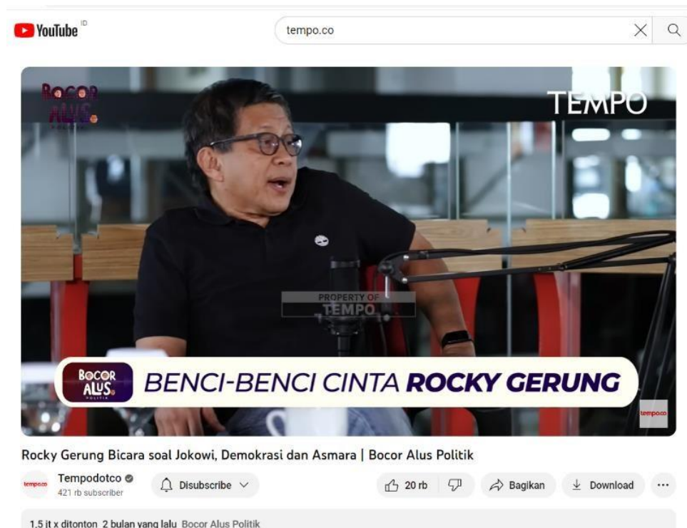
Gambar 1.4 Podcast Bocor Alus Politik 12 Agustus 2023