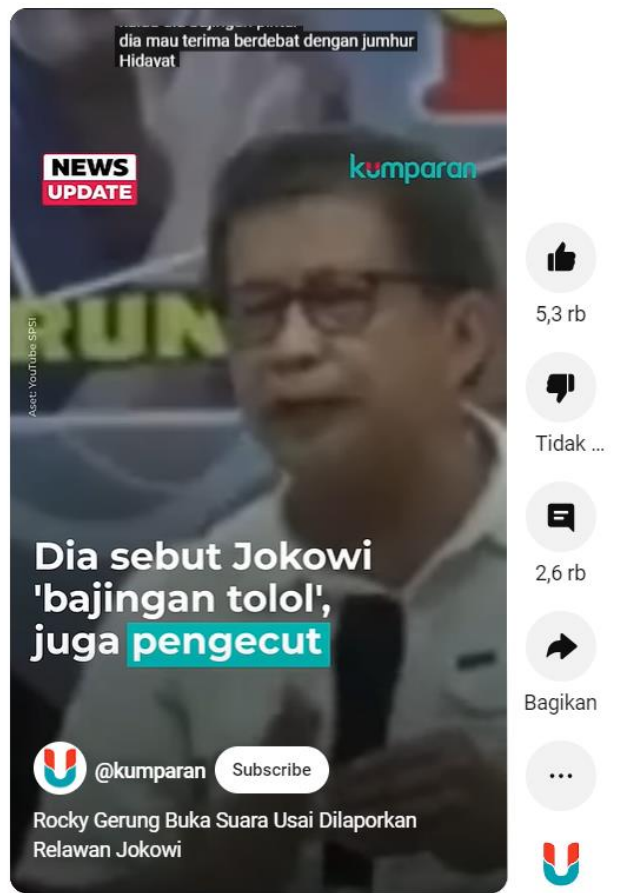
Gambar 1.6 Potongan Video Rocky Gerung Penghinaan kepada Jokowi