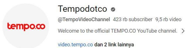
Gambar 1.2 Channel Tempodotco