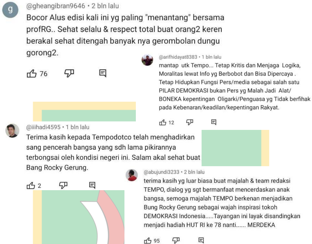
Gambar 1.5 Komentar Warganet

Dari komentar diatas bahwa Media Tempo menunjukkan keunggulan dalam penyajian podcast Rocky Gerung dengan memberikan platform yang memungkinkan pendengar untuk mendapatkan wawasan mendalam melalui analisis tajam dan pandangan kritisnya,memperkaya diskusi publik dengan sudut pandang yang mendalam dan informatif.